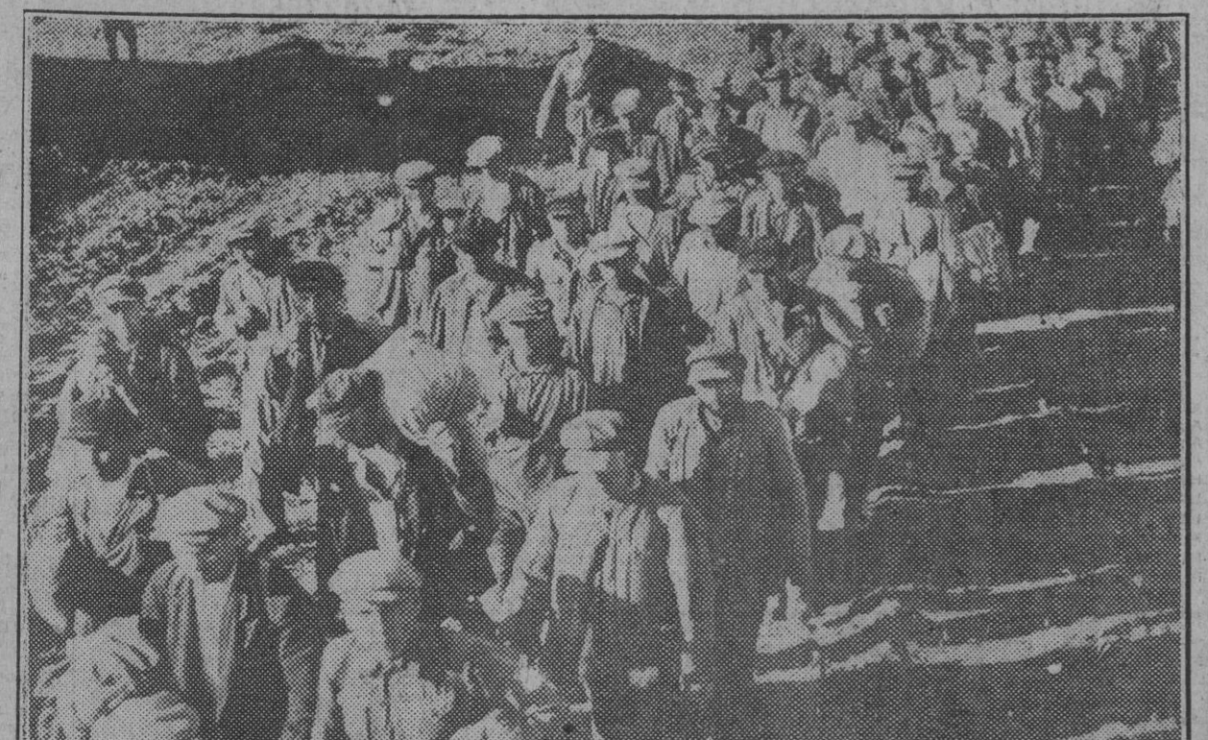
Continuamente aumenta el número de prisioneros bolcheviques que afluyen a los campos de concentración de la retaguardia. He aquí una columna de ex soldados de Stalin capturados por las tropas italianas en el territorio que van a ocupar en ellos las fuerzas de la nueva Europa al convertirlas en verdaderos trabajadores.