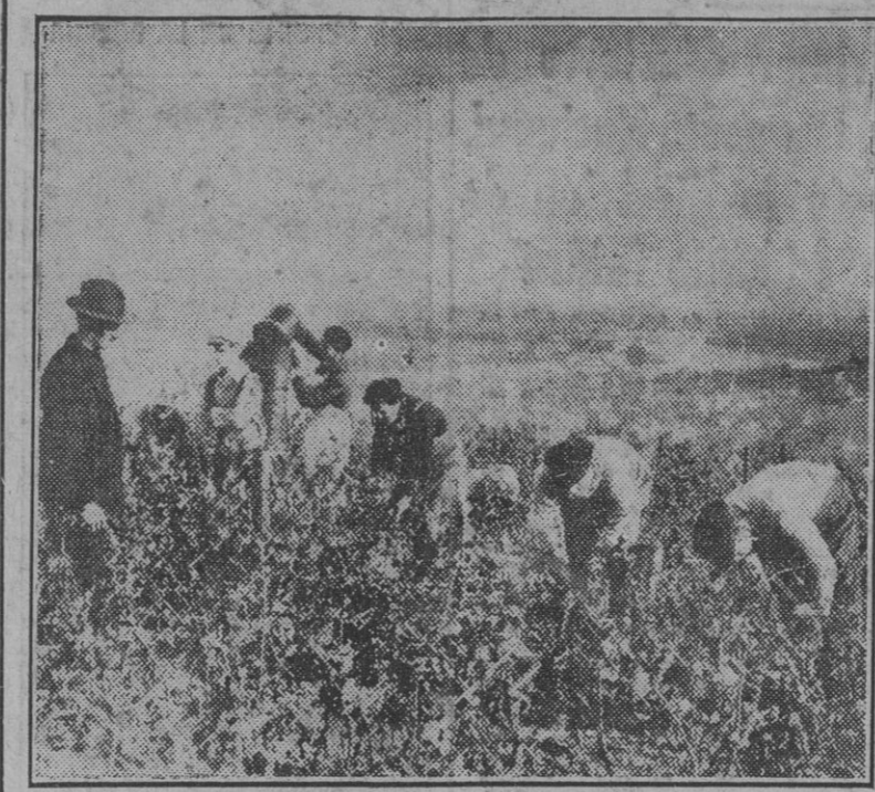
Mientras en el frente del Este el Ejército del Reich ríe una batalla gigantesca, en la retaguardia la población campesina se afana arduamente en su esfuerzo cotidiano, con el que contribuye a asegurar la victoria de los soldados. Un grupo de vendimiadores aparece aquí entregado a las faenas de la cosecha, que este año se ofrece ubérrima en Alemania, sobre un fondo de paz en el paisaje maravilloso.