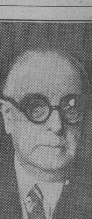
Don Pedro Fernández Valladares, nuevo subsecretario de Gobernación.