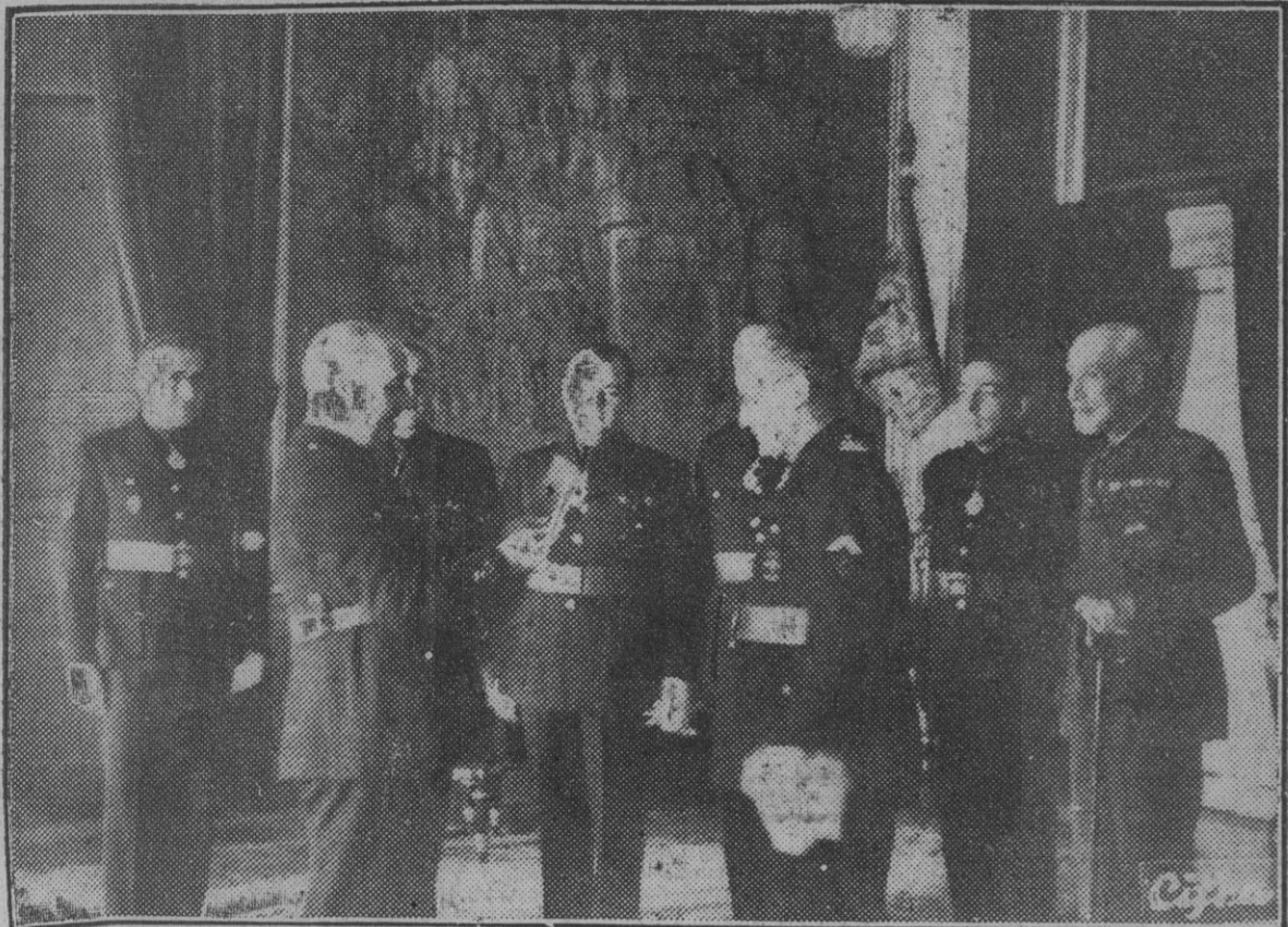
El presidente y miembro de la Gestora Provincial de Madrid durante la entrega a S. E. el Jefe del Estado de la cédula de honor, acto efectuado esta mañana en el Palacio del Pardo.