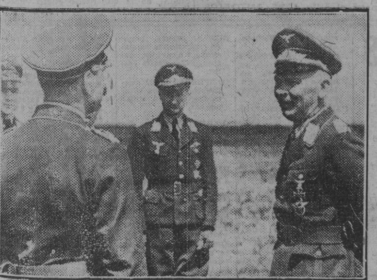
El general Von Richthofen conferencia con jefes de unidades y comandantes con objeto de ultimar detalles sobre las operaciones de la aviación del Reich en colaboración con las fuerzas de tierra que operan en el Este.

gada de Su Excelencia el jefe del Estado prorumpió en entusiásticas aclamaciones y gritos de "¡Franco! ¡Franco!". En la plaza de los Pueros aguardaban al Caudillo el Ayuntamiento bajo mazas, el comandante militar de la plaza, el jefe local del Movimiento, el deán de la Catedral y todas las autoridades y jerarquías locales. Al llegar a la plaza, el Generalísimo descendió del coche entre las entusiásticas aclamaciones del público, que pugnaba por acercarse al jefe del Estado. El alcaide pronunció unas palabras de bienvenida, a las que correspondió el Caudillo con otras de gran cordialidad.