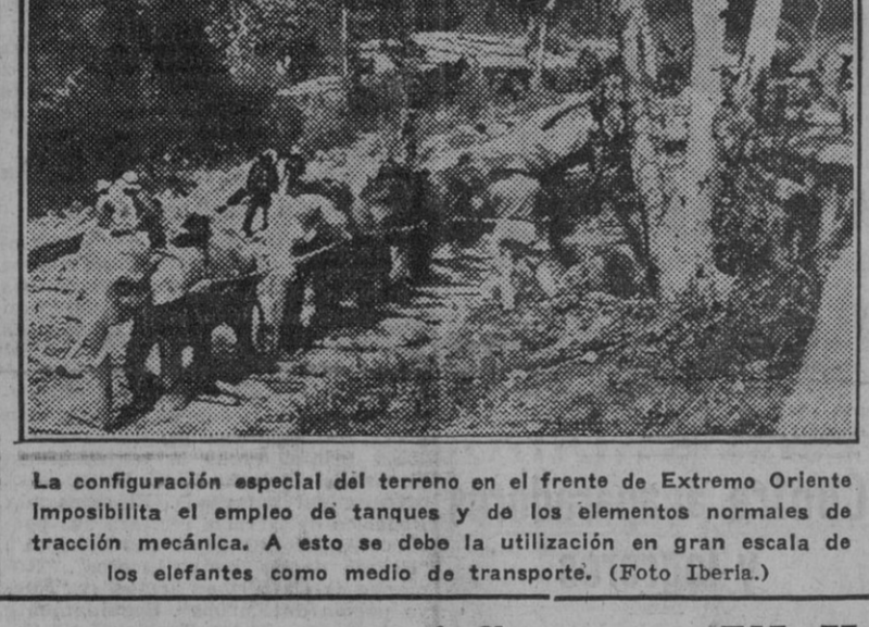
La configuración especial del terreno en el frente de Extremo Oriente imposibilita el empleo de tanques y de los elementos normales de tracción mecánica.

Desde ROMA Penas y multas a los infractores en materia de abastecimientos DISMINUYE CONSIDERABLEMENTE LA DELINCUENCIA EN ITALIA