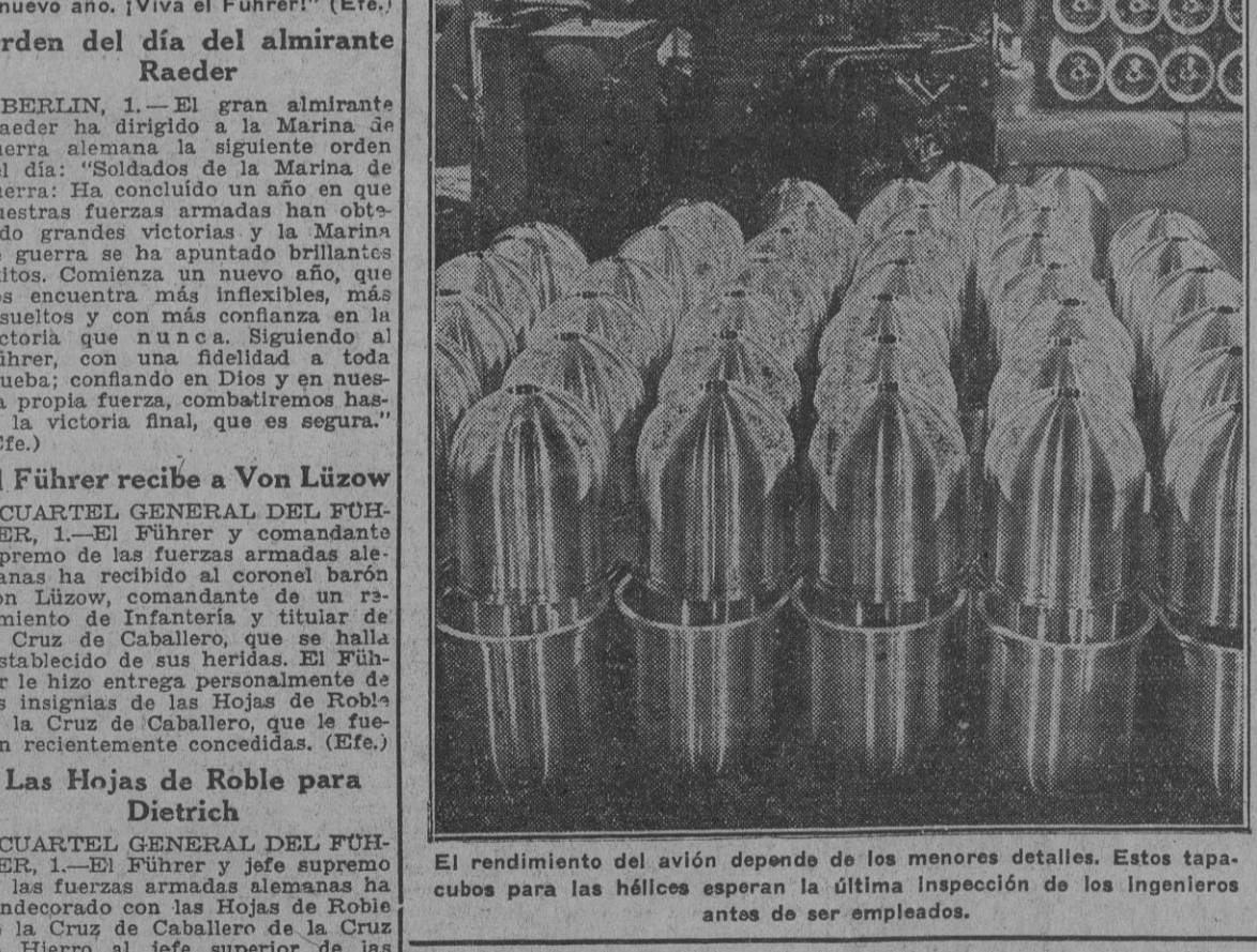
El rendimiento del avión depende de los menores detalles. Estos tapacubos para las hélices esperan la última inspección de los ingenieros antes de ser empleados.

AVIONES, CRUCEROS, ACORAZADOS, DESTRUCTORES Y OTROS BARCOS QUE HAN PERDIDO LOS ALIADOS Las pérdidas japonesas son ínfimas