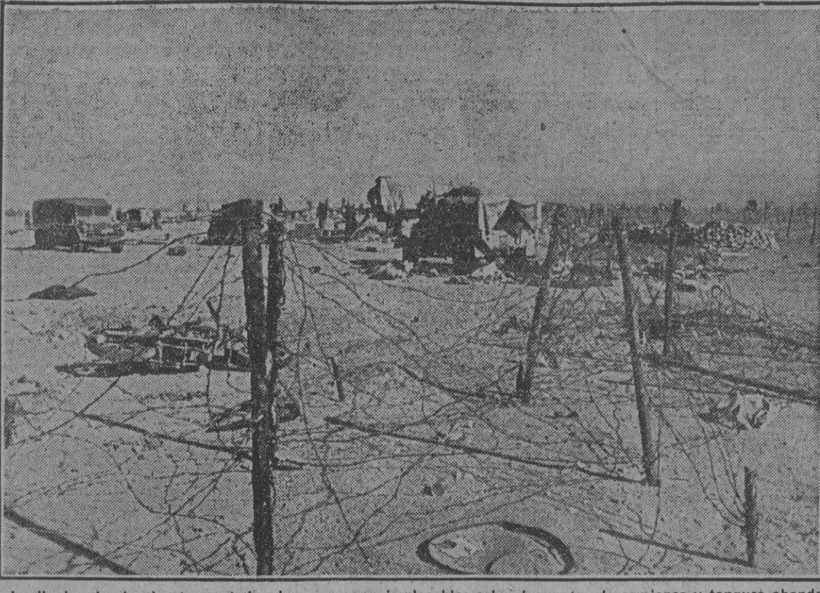
La lluvia, el sol y las tempestades de arena caen implacables sobre los restos de camiones y tanques abandonados por los ingleses en un sector de Libia.