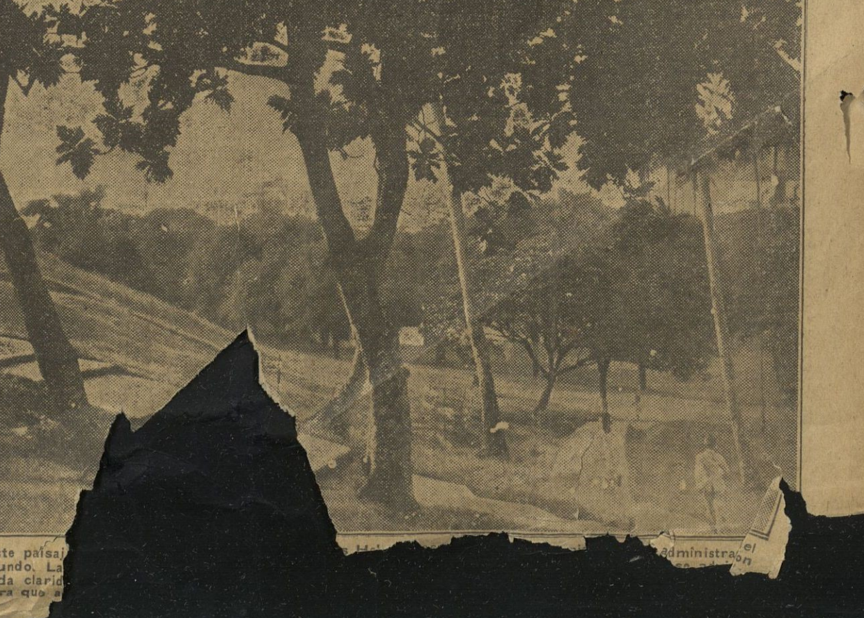
Este país... (Caption partially obscured)