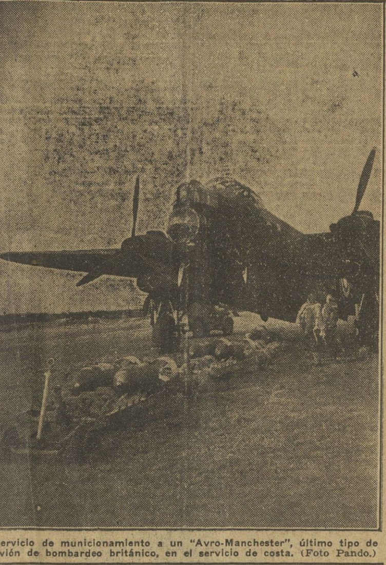
Servicio de municionamiento a un "Avro-Manchester", último tipo de avión de bombardeo británico, en el servicio de costa.