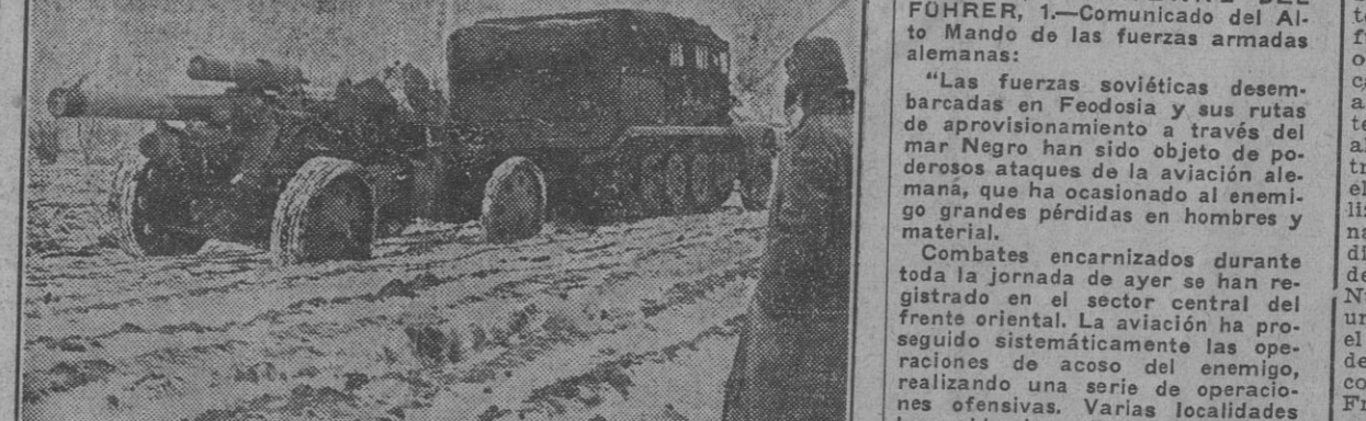
En el barro ni la nieve impiden el avance alemán, cuya artillería y vehículos pesados se abren paso entre el fango helado de los caminos.

SIEMPRE ADELANTE... AVIONES SOVIETICOS ANIQUILADOS EN LA ORILLA DEL ILMEN