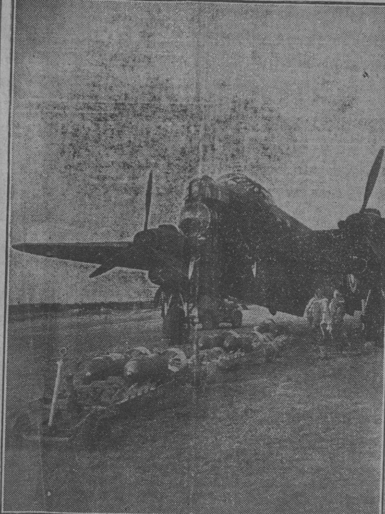
Servicio de mantenimiento a un "Avro-Manchester", último tipo de avión de bombardeo británico, en el servicio de costa.