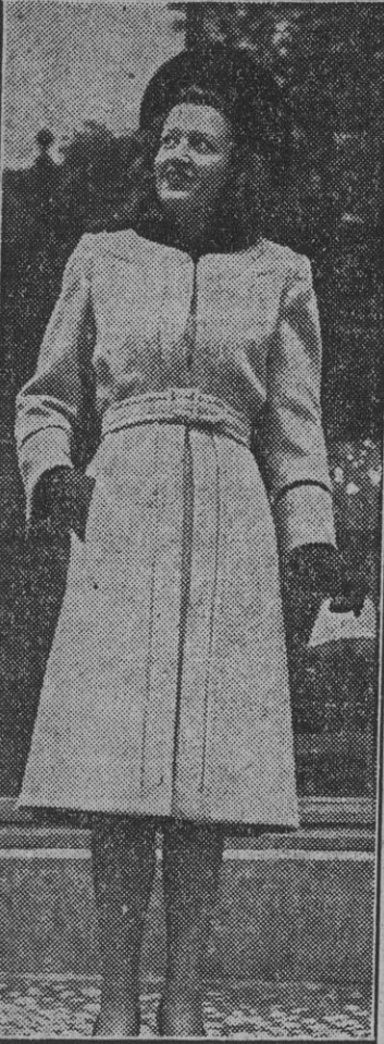
Precioso modelo de abrigo blanco entallado y abrochado a la cintura por un cinturón de la misma tela y un broche de huso.

Artesano: Mejora tu oficio y tu vida. El Servicio Nacional de Artesanía, en comunidad sindical, puede ayudarte a lograrlo.