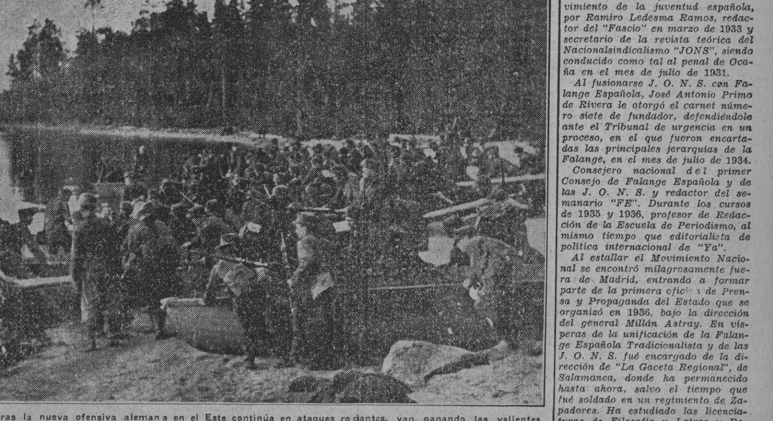
Mientras la nueva ofensiva alemana en el Este continúa en ataques rotundos, van ganando las valientes tropas finlandesas más terreno de lucha de los Soviets. Aquí cruzan las tropas finlandesas, con lanchas rápidas, un lago en Carelia del Este.