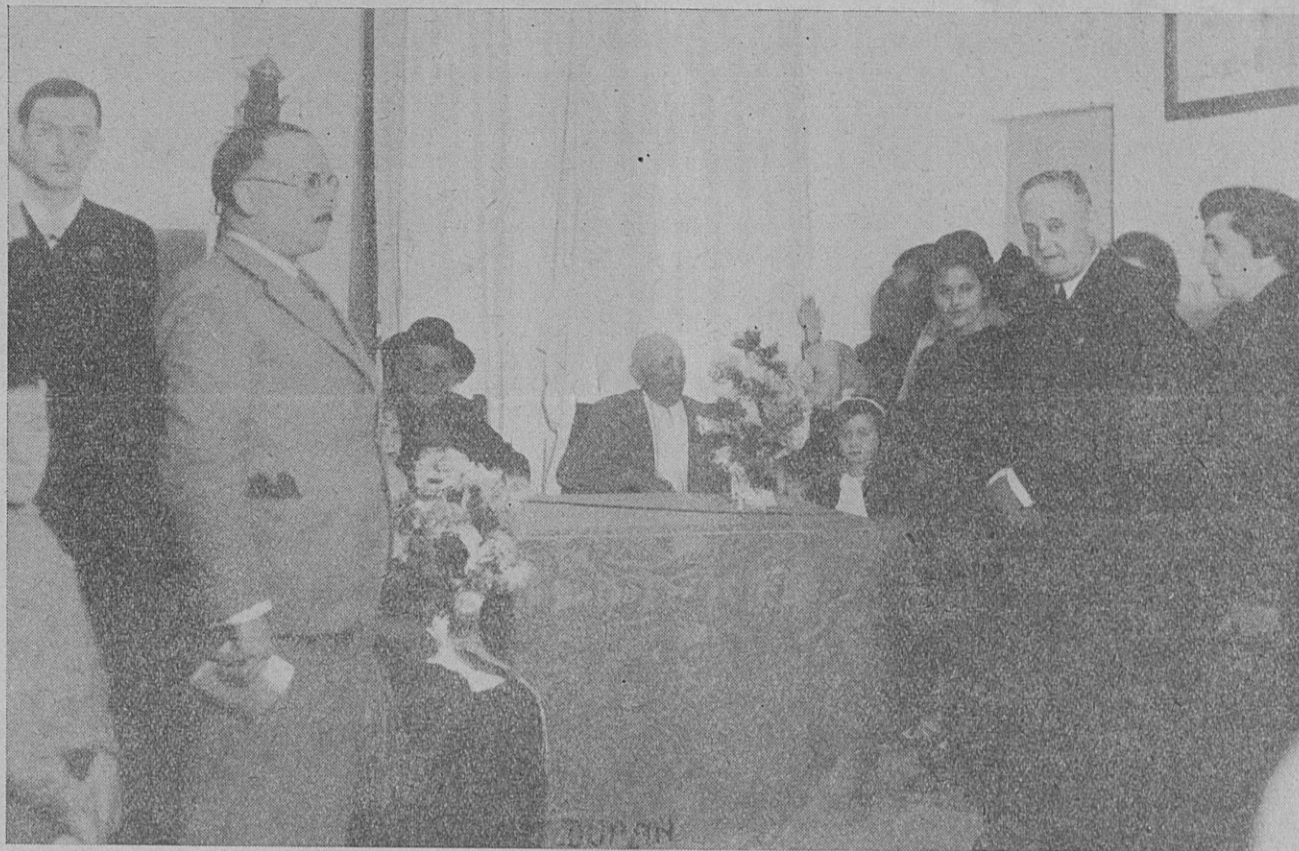
Los viejecitos homenajeados por la C. de P. en el acto del pasado domingo.