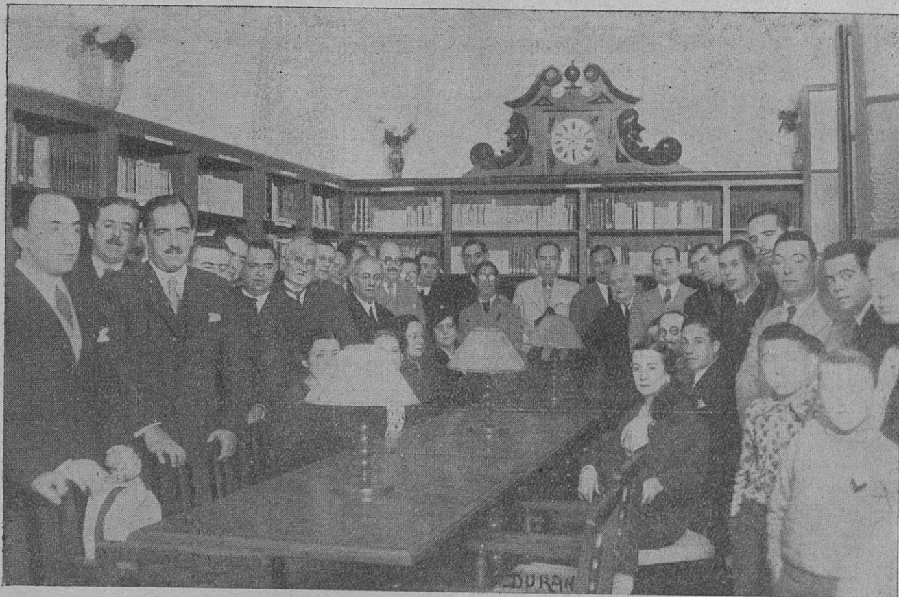
Grupo de autoridades asistentes a la inauguración de los nuevos locales de la Sucursal en Manacor de la Caja de Pensiones para la Vejez y de Ahorros.