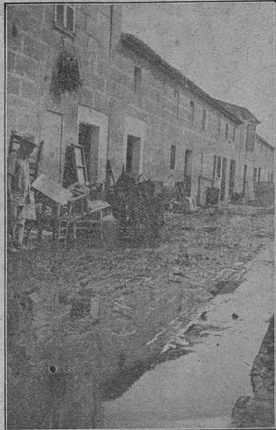
Una vez amansado el torrente se pudieron recoger estos muebles destrozados.