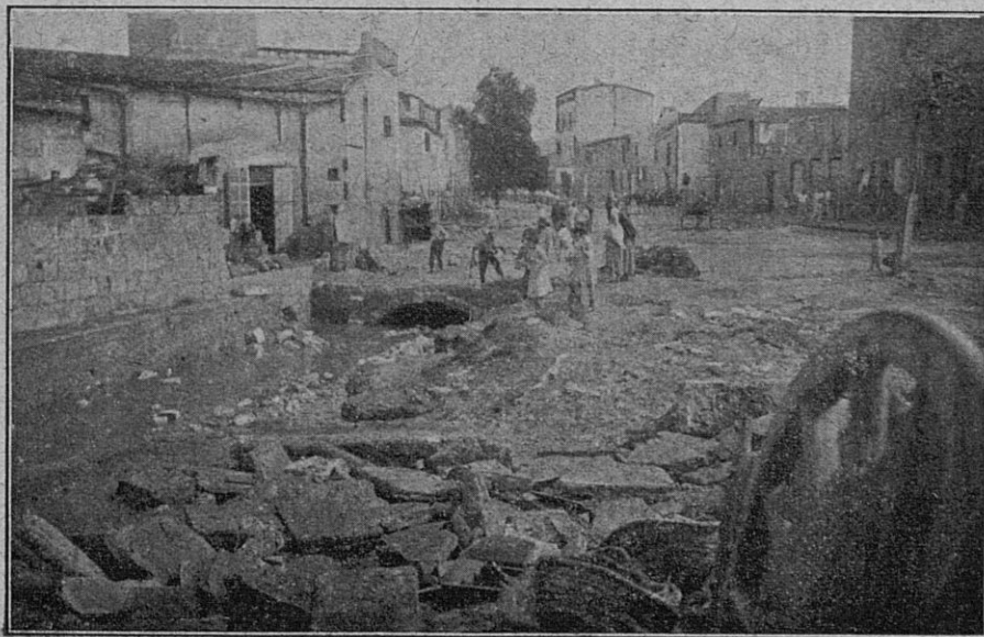
Deplorable aspecto que presentaba la calle del Torrente después de la inundación.

La Fiesta de la Flor, organizada por jóvenes entusiastas y llevada a la prác-