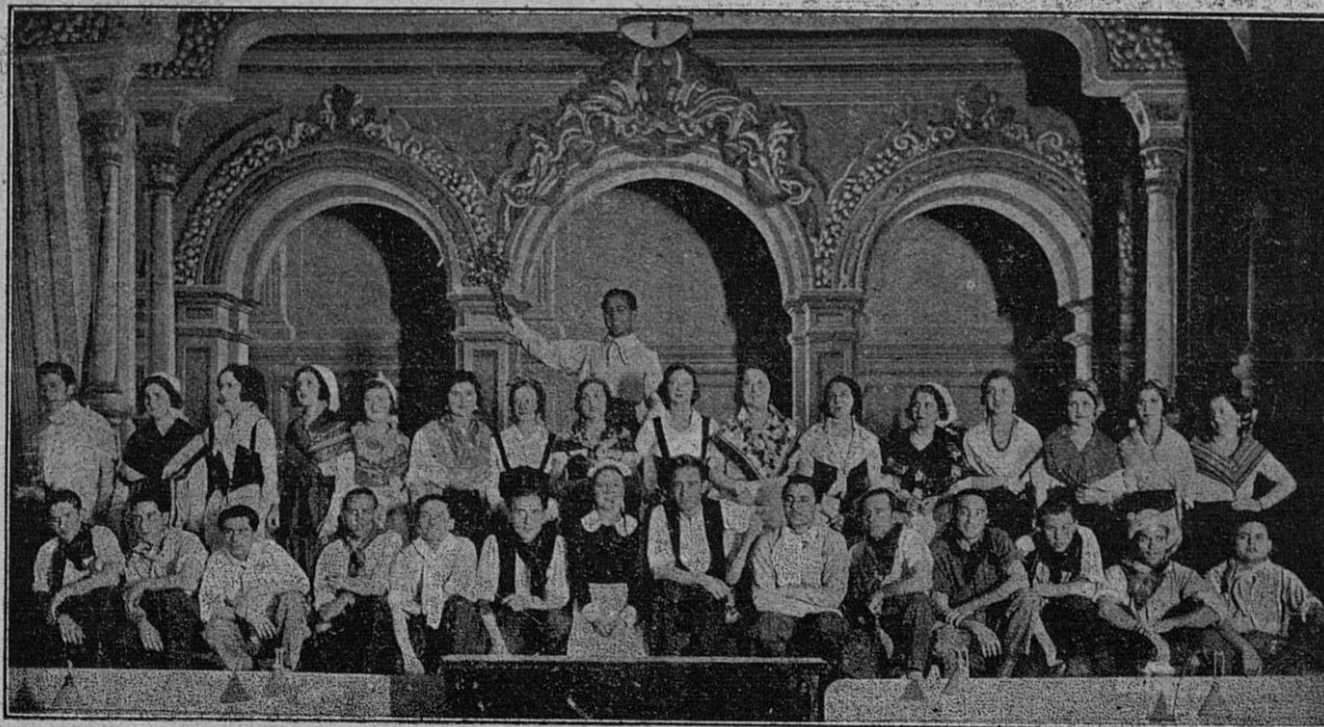
Pareja cómica y coro de la obra «Amor de Muñecos», que se representará el próximo martes en el Teatro Lírico de Palma a beneficio de los damnificados.