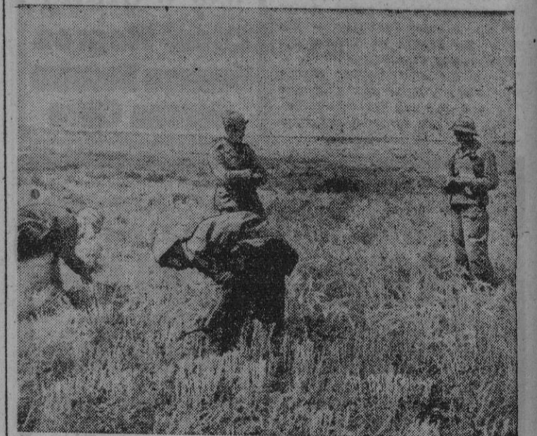
SOLDADOS ALEMANOS EN AFRICA DEL NORTE PRESENTAN COMO LOS NATURALES RECOGEN LA EXIGUA COSECHA DE CEBADA QUE LOGRAN ARRANCAR A TAN POBRES TIERRAS