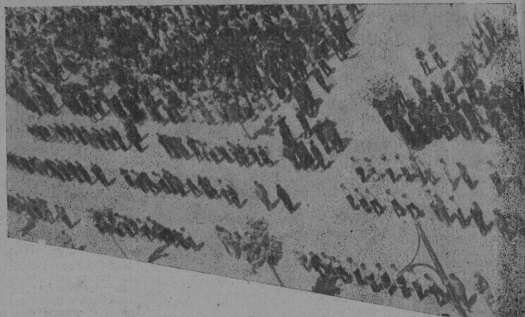
Vista parcial de una de las vías laterales que daban frente al altar durante la Misa de campaña

talleres de cerrajería, carpintería, electricidad, dibujo y modelado, causando a los asistentes esta última sección gran admiración por el funcionamiento y por el trabajo que en ella efectúan los alumnos especializados.