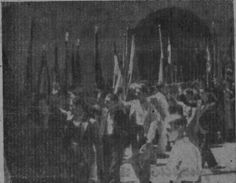
Un grupo de banderas apostadas en el patio de la Comandancia Militar mientras continuaba el desfile