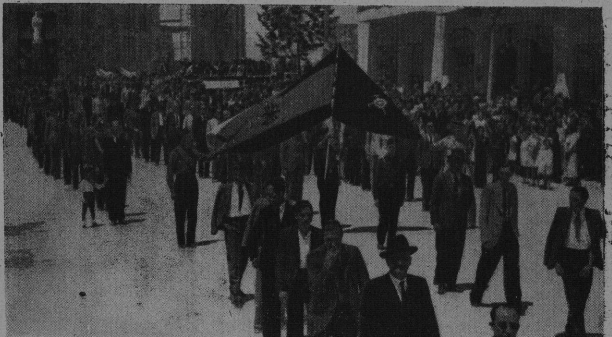
Los empleados de despachos y oficinas desfilando tras su bandera sindical

militarmente parecían contestar con un gesto de triunfo a la aguda frase de Prieto, diciéndoles a todos los rojos: "Venceremos nosotros, porque nuestra retaguardia es la mejor organizada, porque nuestras milicias de paz son tan invencibles como las milicias bélicas, y porque con nuestro Trabajo en las sementeras, en los talleres y en las fábricas queremos