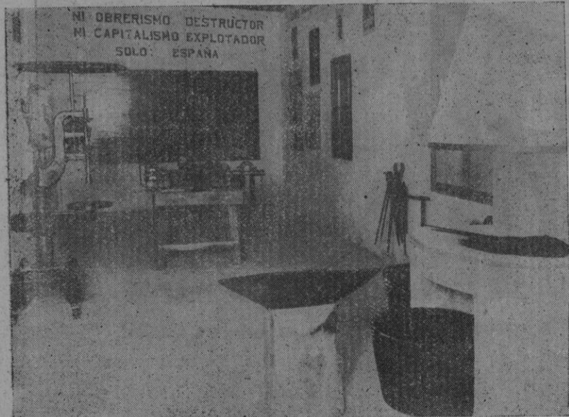
Detalle de la Escuela de Lluchmayor