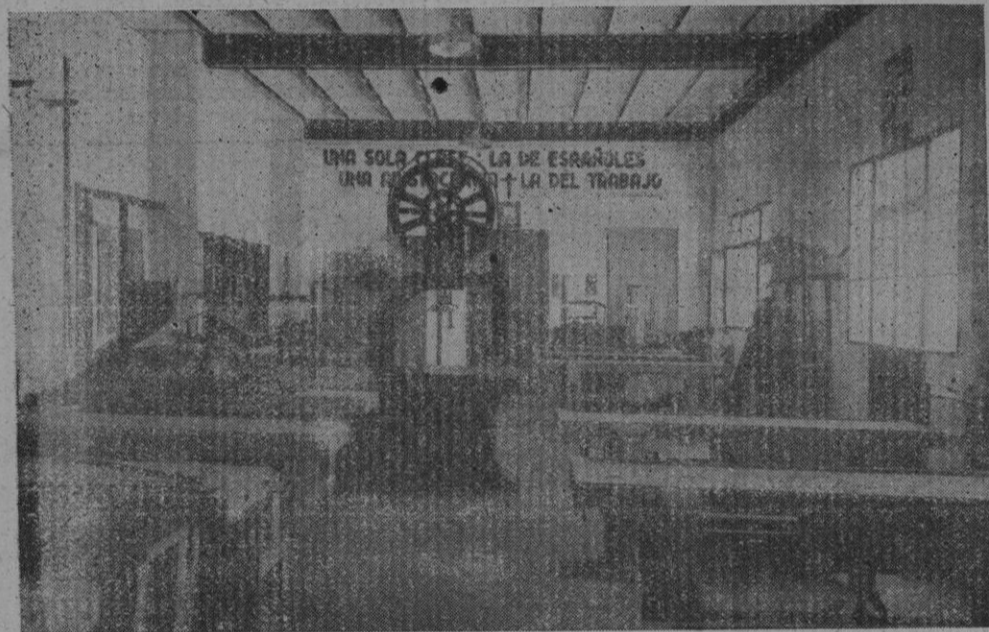
Un aspecto de la Escuela de Trabajo de Palma

Al salir de la mencionada visita, las Autoridades felicitaron efusivamente a los organizadores de la Escuela que con tanto entusiasmo trabajan en obra tan positiva como es la de preparar al obrero para el engrandecimiento de la Patria.