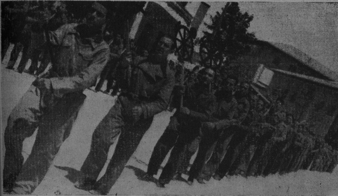
Los alumnos de la Escuela de Felanitx, desfilando