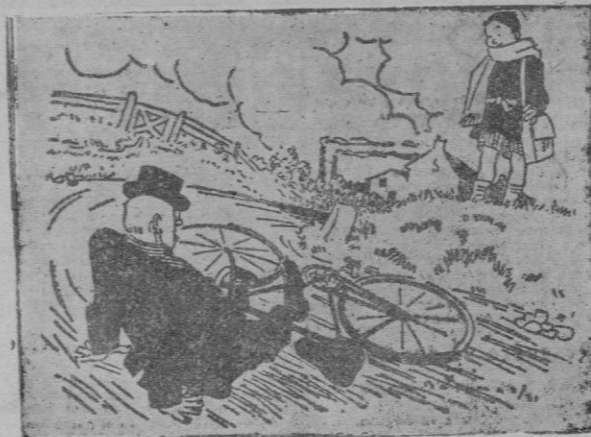
—Señor, ésa no es la manera de apearse.