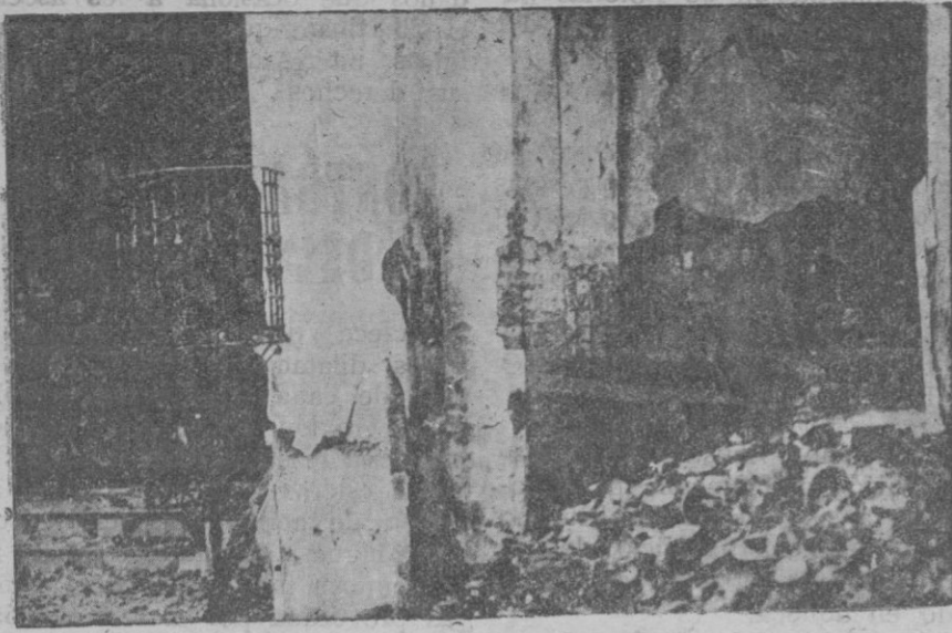
Púlpito y camaril de la Virgen de la Encarnación, de la iglesia de Gerena, después del incendio, que sólo ha dejado en pie los muros