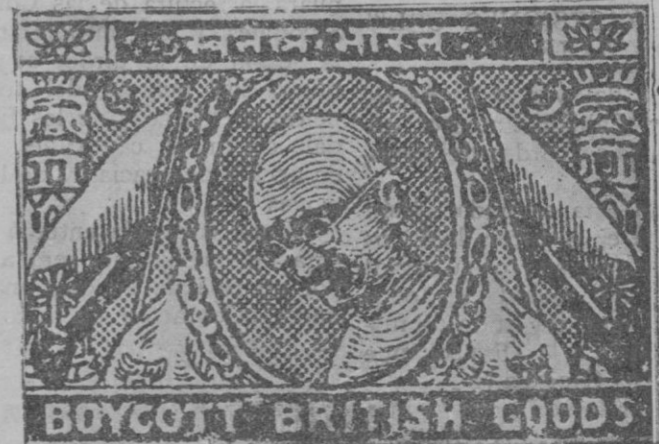
Sello del boycottage contra las mercancías inglesas, emitido por nacionalistas indios, con el retrato de Gandhi

vecino de Inca cuyo coche era viejo y no podía llevar gran velocidad.