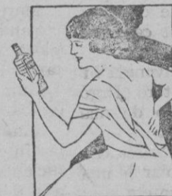
DOLOR DE ESPALDA

Alivie el dolor con Linimento de Sloan. Aplíquese suavemente sin frotarlo. Produce alivio inmediato.