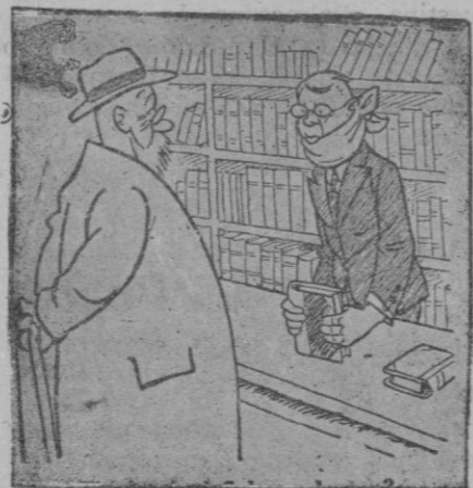
—¿Tiene usted Schopenhaur? —Aquí les llamamos anginas. (De How en «Lustige Blätter» de Berlin)

belleza ha hecho de ellas estrellas favoritas del Cine, tenemos la impresión, después de estas breves intervenciones de la Aguglia que han sido como chispazos precursores de una posible coronación con los oropeles del estrellato cinesco, que aún sin poder alardear de belleza física como la que dotó a Marlene Dietrich de unas piernas estupendas por las que ascendió al estrellato, la veterana actriz siciliana puede con su belleza espiritual y hasta con su simpática fealdad, alcanzar un triunfo estimable gracias a su supremo talento y a la propia experiencia que puede haber añadido en la dura misión de luchar, dejando en el camino jirones de ilusiones pretéritas y triunfos ruidosos, que cuidó de arrastrar en confuso maridaje, el vendaval de los años, mezclado con la hojarasca mistia desprendida de los otoños que lleva vivos los últimos años de su vida.