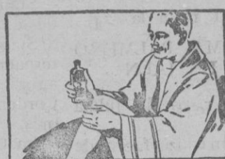
AL PRIMER ASOMO DE REUMATISMO

Ud. puede eliminarla merced al Linimento de Sloan! Aplíquesele con suaves palmaditas.