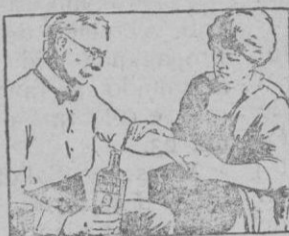
AUN VIEJOS DOLCRES REUMATICOS

ceden ante este sencillo tratamiento. Aplíquese el Linimento de Sloan suavemente y éste llevará a los tejidos roídos por el dolor la sangre fresca y nueva que necesitan para curarse.