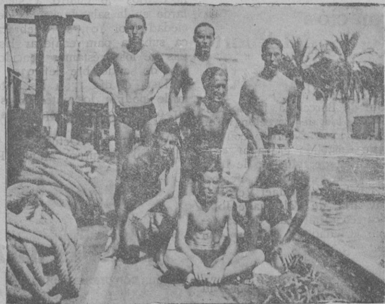
Segundo equipo del C. N. Palma, Campeón de su categoría