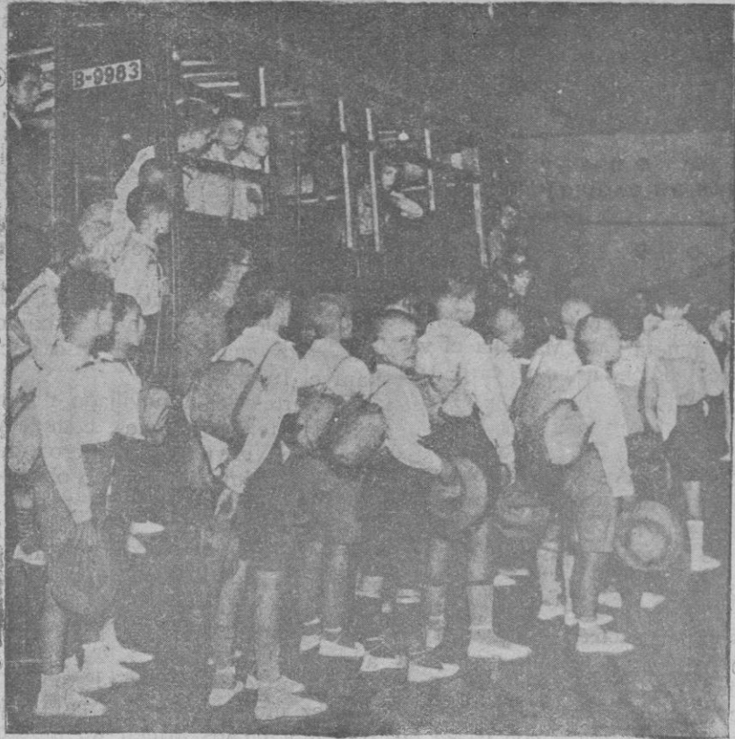
Niños de la colonia escolar de Barcelona, en el momento de embarcar en el «Ciudad de Palma»