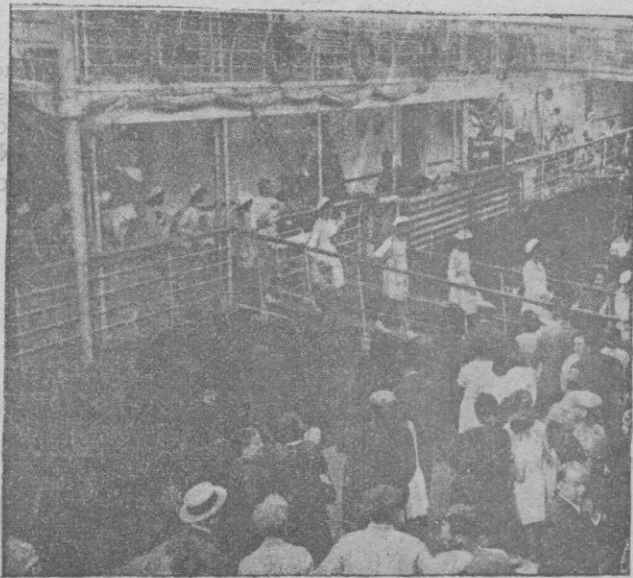
Las niñas de la colonia escolar de Barcelona al regresar a dicha ciudad, procedentes de Mallorca