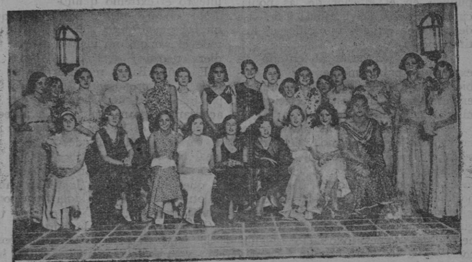
Señoritas que han concurrido al concurso del traje de cuatro pesetas organizado por la popular revista «Fstampa» del que se ocupaba nuestro compañero Sr. Bauzá en la edición de ayer