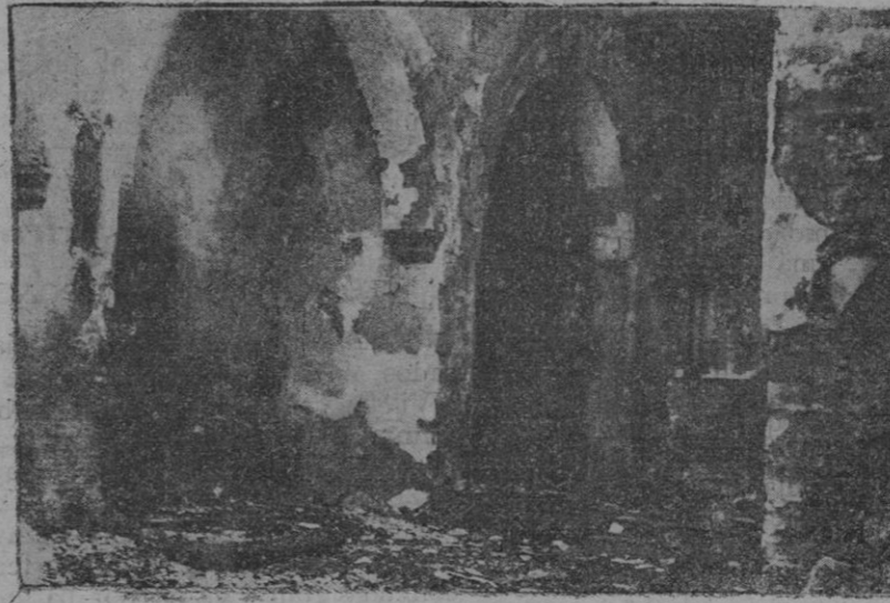
Ruinas de la iglesia de San Nicolás de Granada, que fué incendiada durante los recientes sucesos