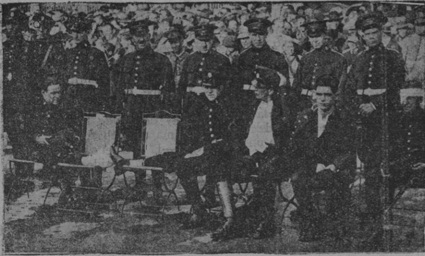
Los heroicos guardias de Asalto heridos por los sublevados, en la fiesta homenaje que se les ha tributado en el Retiro, con asistencia del Presidente de la República y del Gobierno