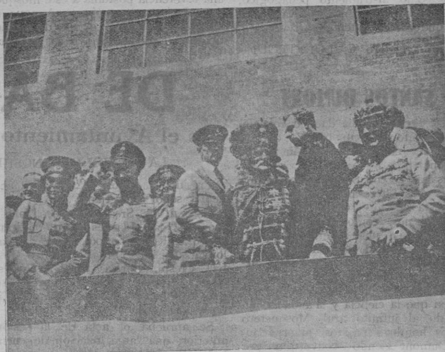
El Kronprinz presidiendo una reunión de los Cascos de Acero

viendonos bañados en plata los dorados rayos del Sol, sobre cuya candente superficie podrán caer un día los fragmentos unares, dislocados por temiendo cataclismo.