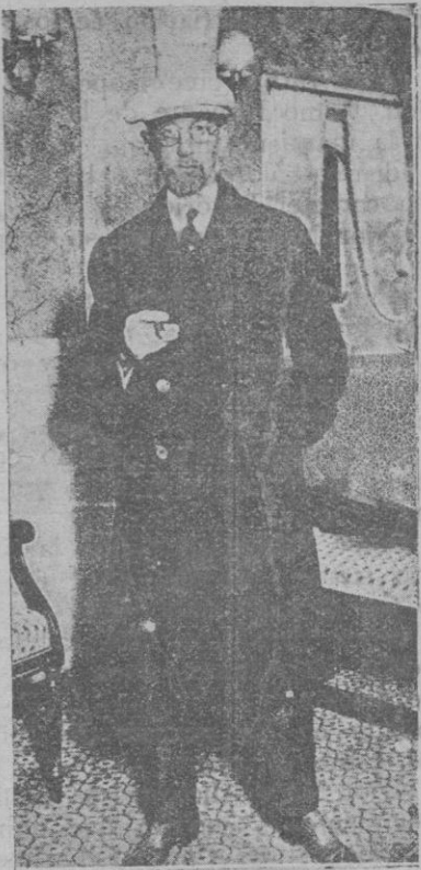
El ex-presidente de la República cubana, que ha sido expatriado por orden del gobierno cubano, a la llegada a la Coruña

escapa de aquel sitio con los ojos llenos de lágrimas. Va a su capilla, y el aspecto de destrucción en que la advierte acrecienta su pesadumbre. La verja ha sido rota por varios puntos, y la Virgen de la Esperanza yace en el pavimento, negra de humo, doblada la corona de peatería y en desorden las vestiduras.