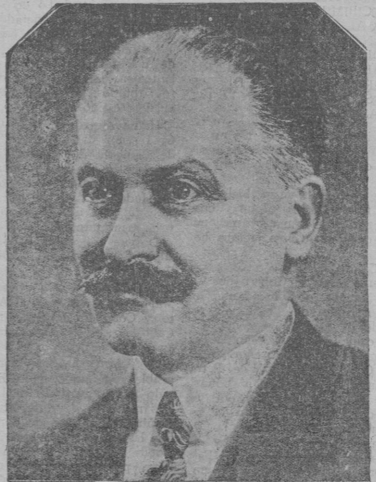
M. Albert Lebrún, presidente del Senado francés, que ha sido elegido para sustituir a Doumer, en la Presidencia de la República