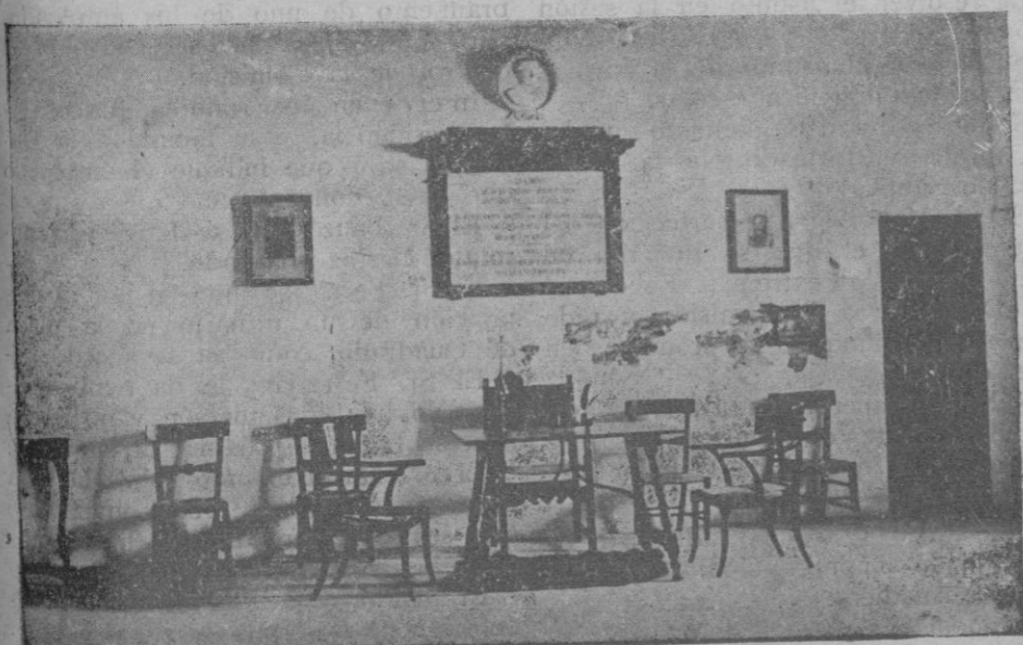
La celda de Jovellanos en el Castillo de Bellver