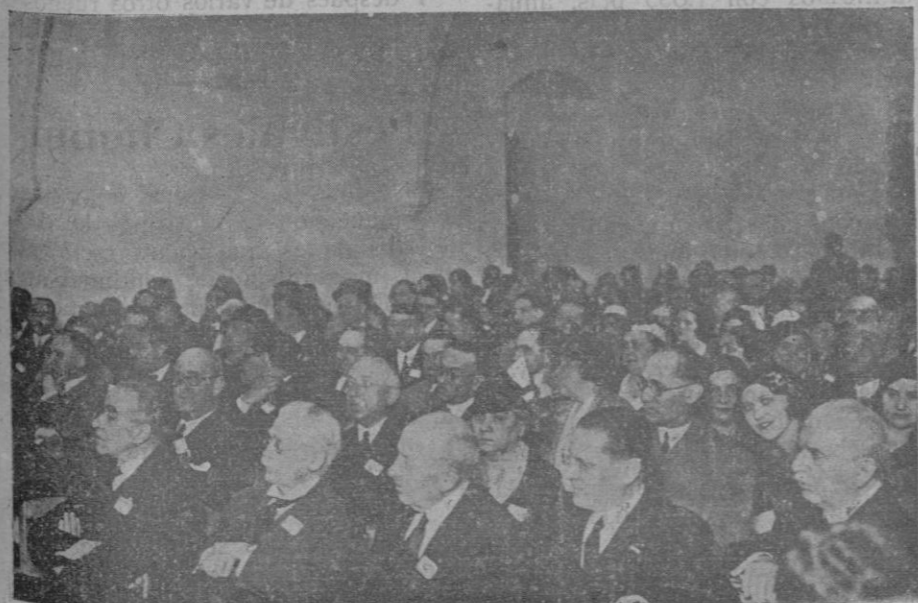
La sesión inaugural de la V Conferencia del Distrito 60, de los Rotary Clubs, en el castillo de Bellver