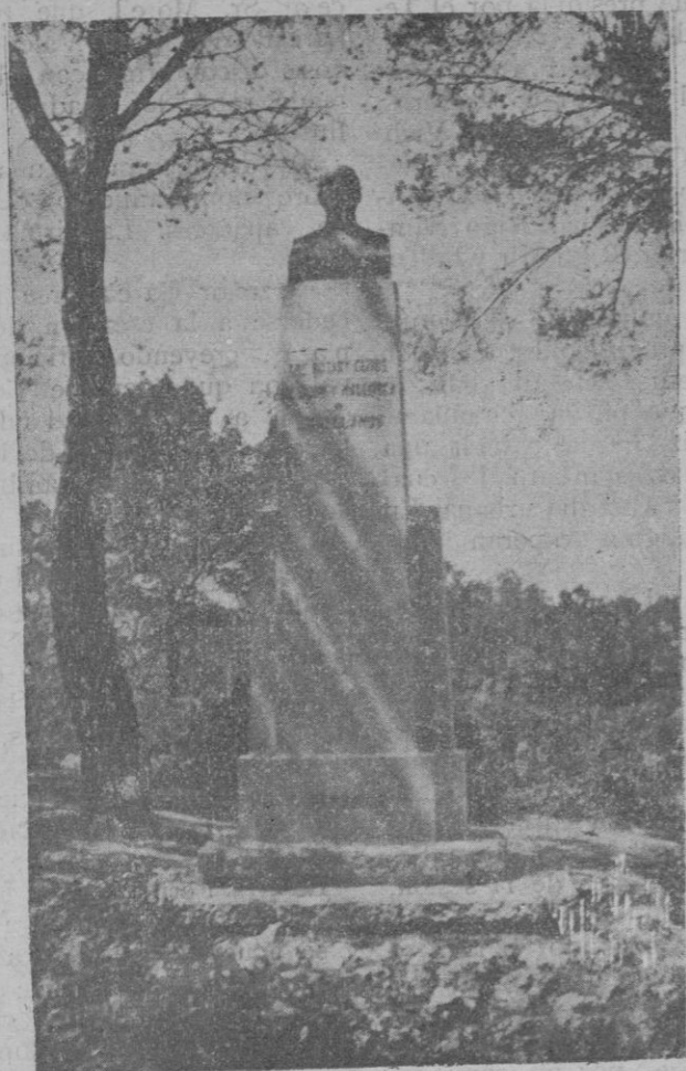
Monumento a Jovellanos en el Bosque de Bellver, obsequio de los Rotarios