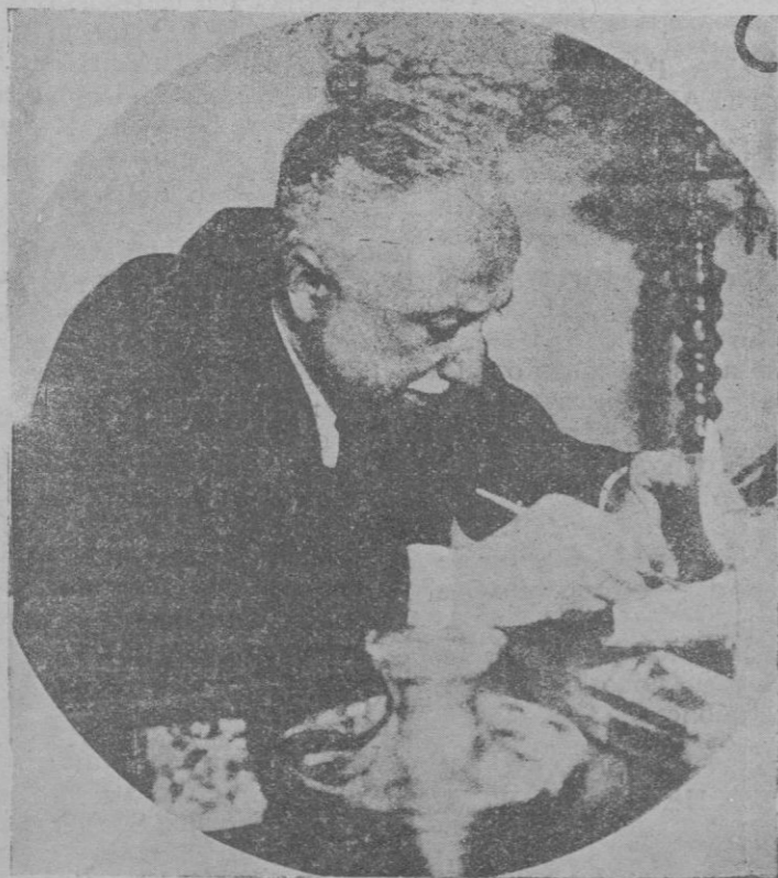
El Sr. Alcalá Zamora trabajando en el despacho de su domicilio particular