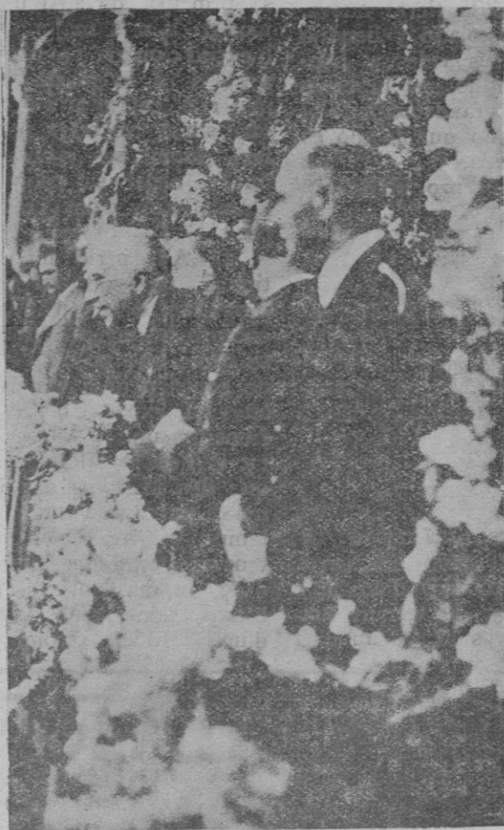
El Presidente en Murcia.—El Sr. Alcalá Zamora, saludando al público desde el palco de la Plaza de Toros.

indicar lo que apetecemos, no como dádiva sino como instrumento de trabajo; Mallorca es ahora la Meca del turismo, y los grandes paquebotes que llegan a nuestras aguas tienen que fondear fuera del puerto y si el mar está agitado, el turista o ha de pasar molestias para saltar a tierra por medio de lanchas u optar por quedar a bordo y renunciar a la visita. Pedimos la reforma del puerto para que puedan en él fondear y atracar los grandes buques de turismo. La mano con el memorial está extendida: El Presidente tendrá junto a sí a los ministros de Marina y de Obras Públicas, a quienes afecta la petición.