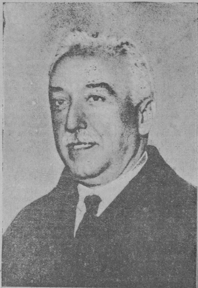
El Excmo. Sr. D. Niceto Alcalá Zamora, Presidente de la República Española