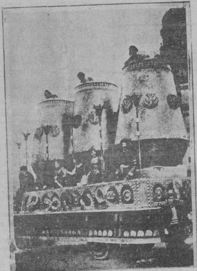
Las calderas de Pedro Botero