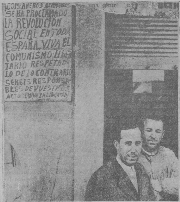
El bando que se fijó en las calles de Solla, proclamando la revolución social