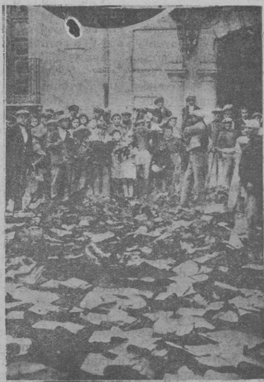
Restos de los archivos del Juzgado municipal y del Ayuntamiento que quemaron los revolucionarios en la plaza

ducirá interés alguno ya que no puede suponerse que por el hecho de tener un nuevo mercado aumente el consumo de la población. Por lo tanto, construir el nuevo Mercado, tal como está proyectado, es un negocio ruinoso para el Ayuntamiento. La única ventaja y en esto están en lo cierto los concejales socialistas, es que ese proyecto es el que está más adelantado en la trayectoria administrativa.