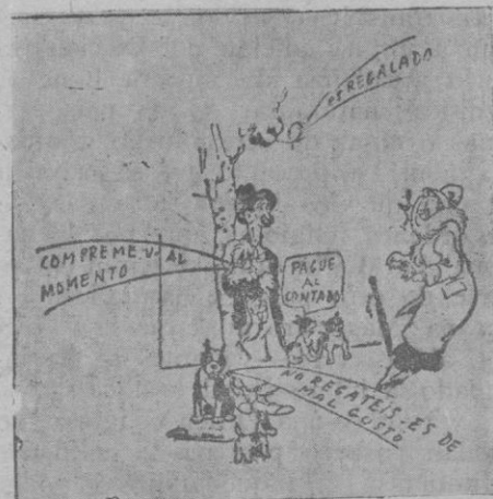
El vendedor de perros ventrílocuo (De Gallo, en «Rig et Rac» de París)

to mi programa de siempre, pero yo no soy revolucionario de acción, ahora soy revolucionario de doctrina; sólo volveré a ser revolucionario de acción en el caso de que los republicanos abandonen la República y aparezca el peligro de una dictadura. (Muchos aplausos.)