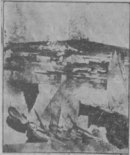
El 'Jonquet', uno de los primeros cuadros de Antonio Gelabert, que figuraba en su primera exposición el año 1902