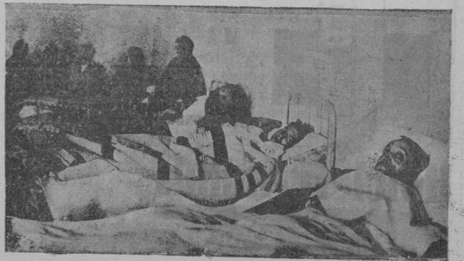
En las salas del hospital de Arnedo. Los heridos que reciben asistencia: diez y seis hombres y seis pobres mujeres