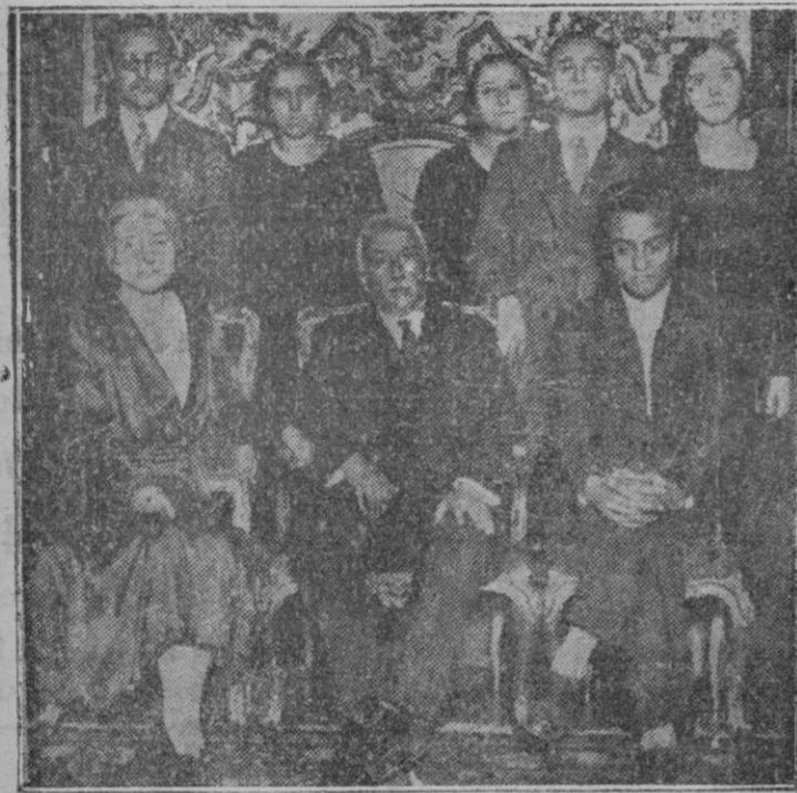
El Presidente de la República, con su esposa e hijos, momentos después de haberle notificada su elección