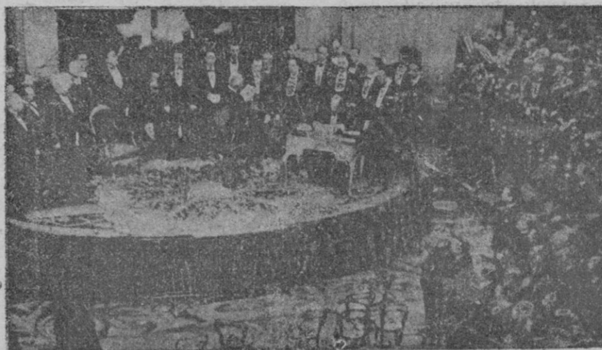
Solemne momento de la promesa del Presidente de la República, Sr. Alcalá Zamora, en el Palacio del Congreso