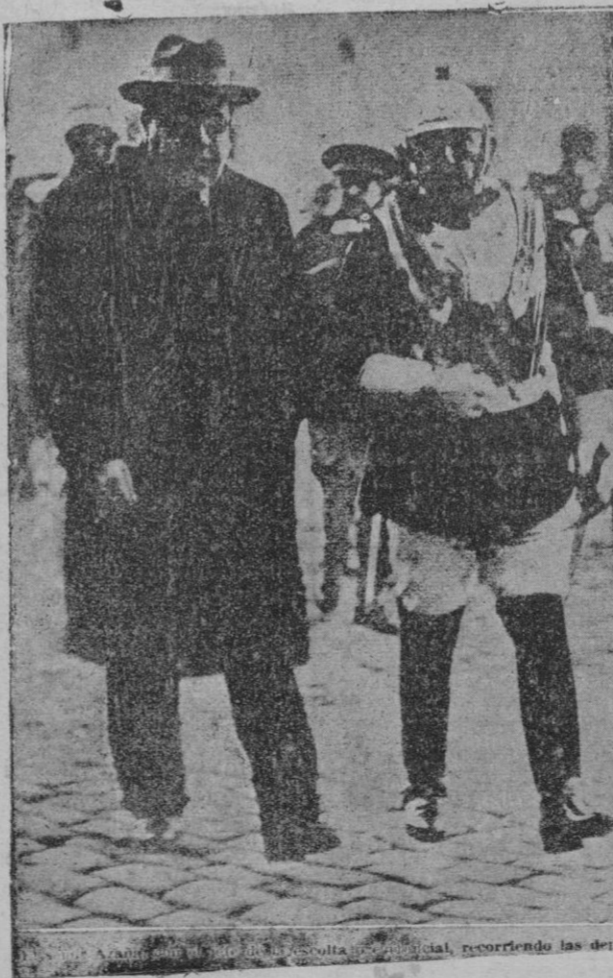
El Jefe del Gobierno Sr. Azáña con el comandante de la Escolta del Presidente