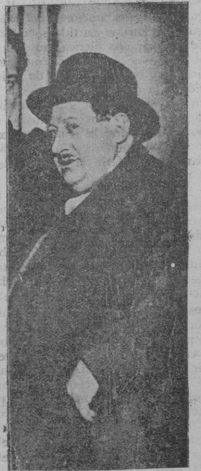
Monsieur Bloch que ha sido estos días la actualidad en Cataluña y en toda España