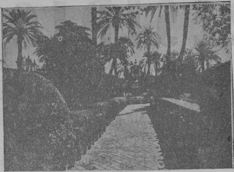
Aspecto de uno de sus magníficos jardines, que con el Alcázar han sido entregados a la ciudad de Sevilla