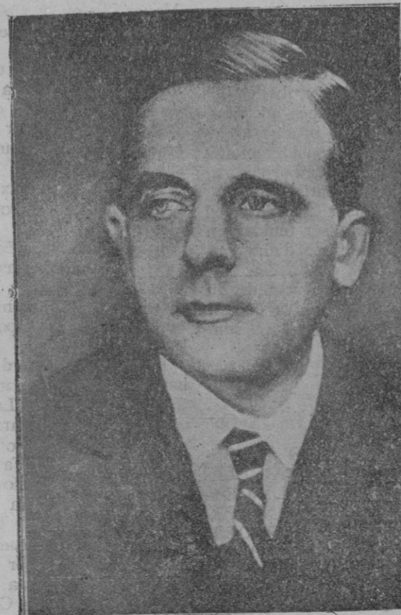
Berlin.—El profesor Otto H. Warburg, director del Kaiser-Wilhelm-Instituto, a quien ha sido concedido este año el Premio Nobel de Fisiología y Medicina