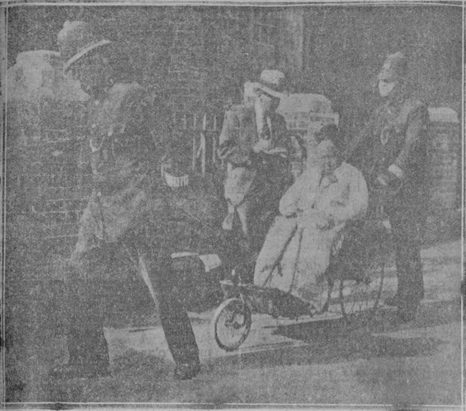
Una electora que, a pesar de estar parálitica se hace conducir a las urnas