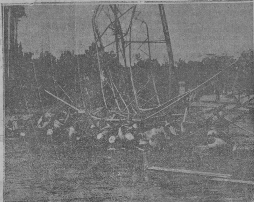
El temporal de Sevilla ha causado grandes destrozos: derribó árboles y casetas. Esta fotografía muestra como quedó la instalación eléctrica de la portalada de la Exposición