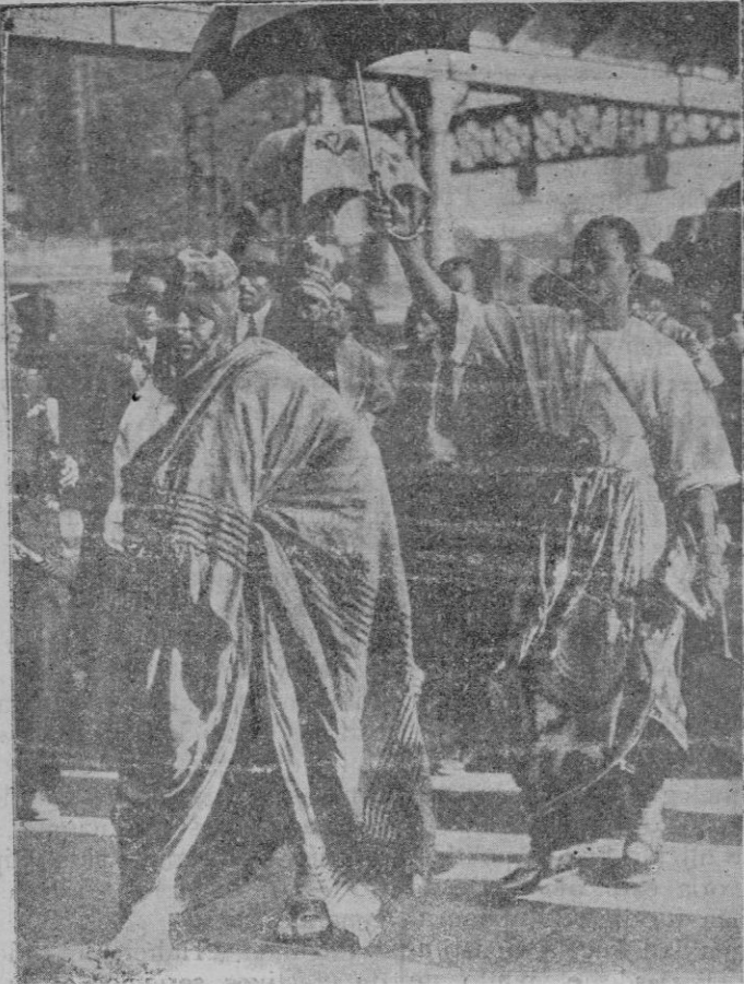
Uno de los cuarenta y cinco príncipes negros que hay en Paris con motivo de la Exposición Colonial, paseando acompañado de uno de sus servidores

Haber visto con singular agrado y complacencia la Asamblea de fuerzas vivas convocada por el Gobernador don Máximo Cajal para impulsar el desarrollo del turismo; asociándose a dicho proyecto y prestarle el más decidido apoyo, lamentando la dimisión de dicha autoridad que ha venido a truncar labor tan patriótica como eficaz en pro de los intereses regionales.