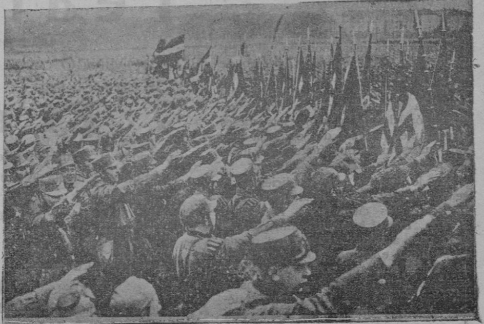
Parada de las fuerzas de Hitler, que prometen fidelidad a sus banderas