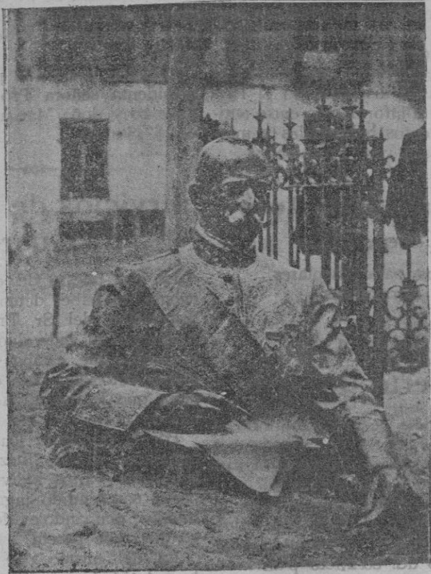
El busto del conde de Romanones, que ha sido desmontado de su pedestal, en la plaza de Gualajara, para ser instalado en la Escuela Normal de Maestros

personas d'edat avansada i haver pogut comprovar en documents i trabais escrits aquestes mateixes explicacions.