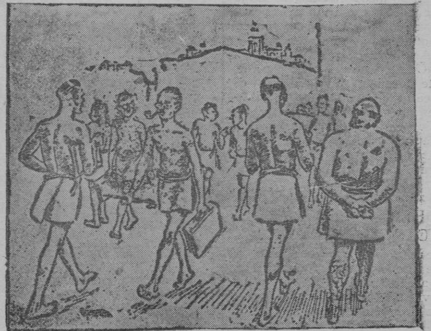
LA CRISIS ECONOMICA BRITANICA

Un aspecto de Londres en el mes de Enero próximo, después de haber pagado los ciudadanos los nuevos impuestos