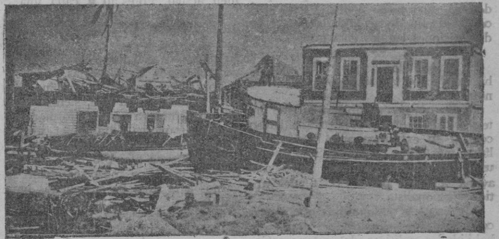
Parcas que fueron arrastradas contra los edificios de la costa por la fuerza de la marea, a doscientas yardas de la playa

Palma de Mallorca ostentando el cargo de Gobernador Civil de Baleares. Y quiero decirlo, porque ello es verídico, que el Gobierno de la República, al otorgarme entonces su confianza (que hasta el último instante he conservado), atendió a mis antecedentes personales y políticos, que si no me reputaban como dotado de cualidades intelectuales excelsas, me acreditaban en cambio como hombre que antes, en la época militante de la lucha por nuestros ideales, supo sacrificar a ellos su seguridad personal, la paz de su hogar y la garantía de sus legítimos intereses.