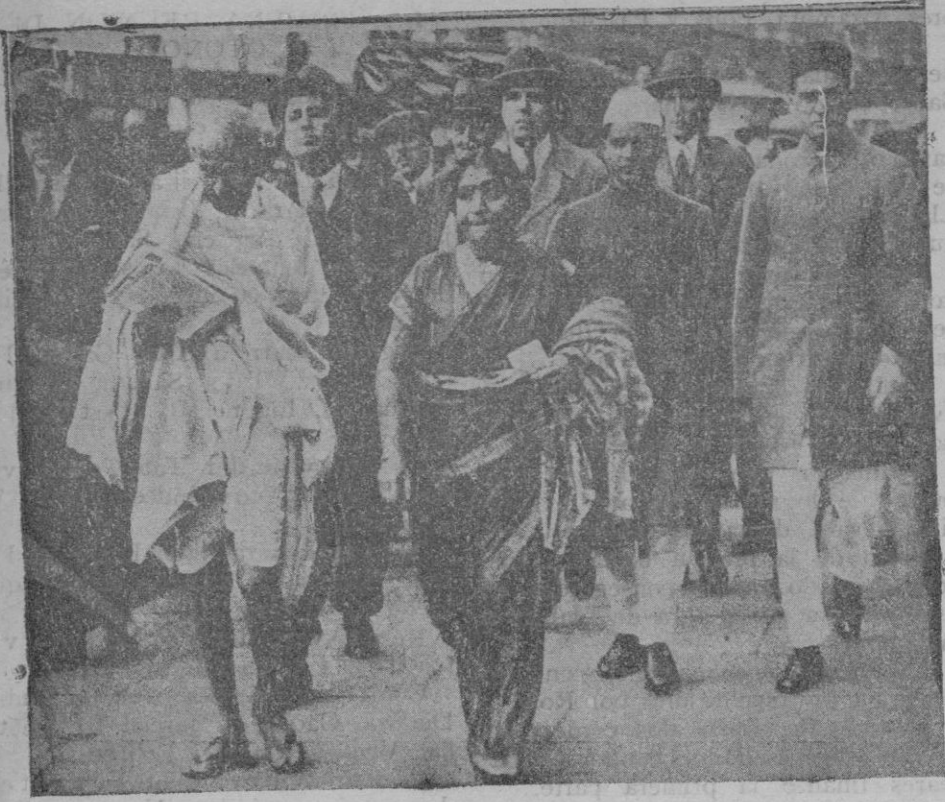
Londres.—Mahatma Gandhi, jefe nacionalista indio, con su secretaria particular dirigiéndose a la Conferencia de la Tabla Redonda