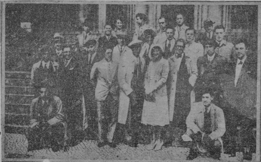
Los jugadores españoles de fútbol del Madrid F. C., al salir de visitar la Catedral de Berlín