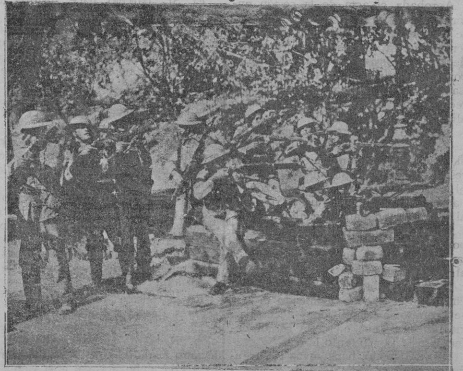
Soldados afectos al Gobierno que tomaron parte en los encuentros con los sublevados, en una de las calles de Lisboa

provincia al régimen que establece el artículo 2.º del Decreto del Ministerio del Trabajo de 18 de Julio último.