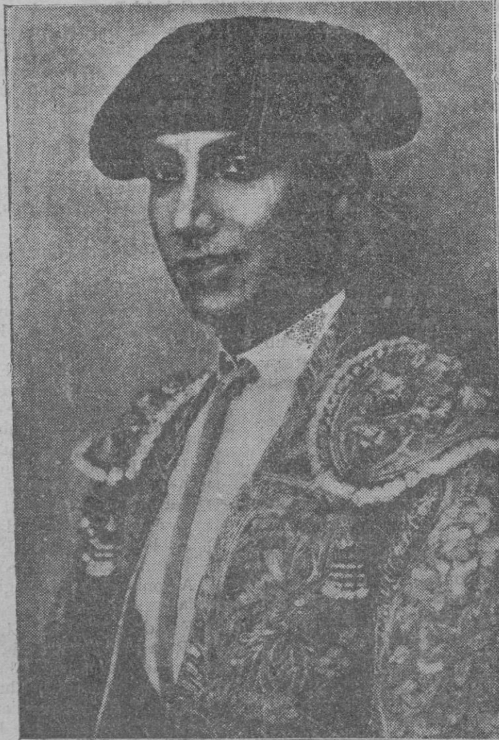
El desgraciado torero que ha fallecido después de dos meses de atroces sufrimientos

blica serán ejecutadas en las regiones autónomas por las autoridades regionales, salvo aquellas leyes cuya ejecución son atribuida a órganos especiales o en cuyo texto se disponga lo contrario.