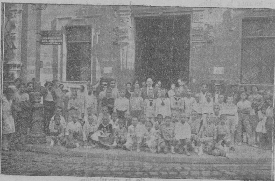
La colonia escolar municipal de niños, en la plaza de Cort, antes de salir para El Terreno