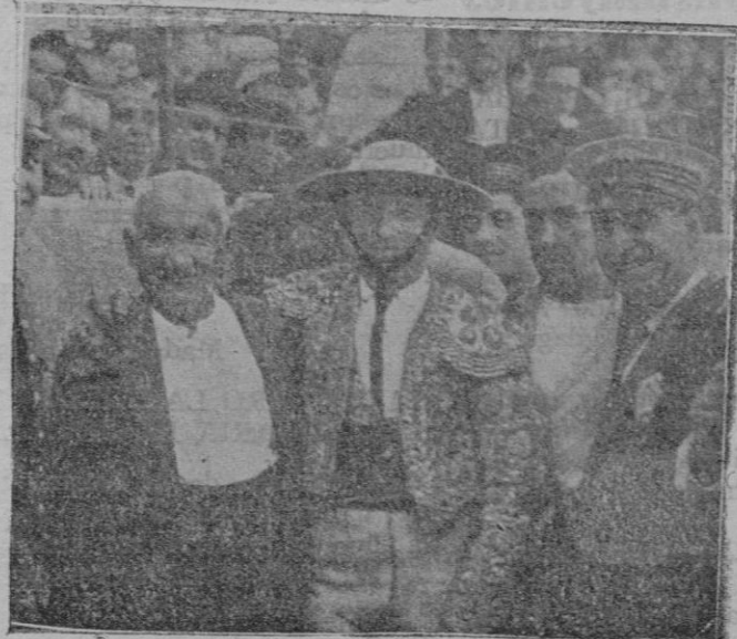
Este viejecito, de pelo blanco, es el veterano picador «Agujetas», ídolo de los aficionados, muy aplaudido en Palma donde actuó con la cuadrilla de Espartero. Esta fotografía es obtenida en la plaza de Tetuán, en donde fué reconocido el veterano torero por el público que le tributó una manifestación de simpatía