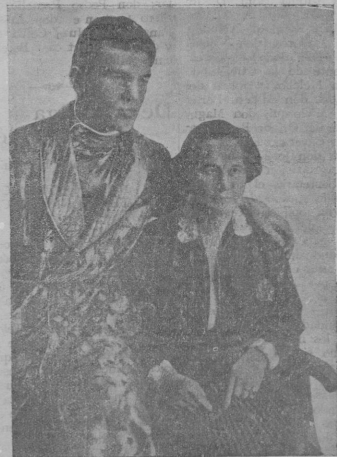
Max Schmelling en compañía de su madre, antes de emprender el viaje a América, para combatir con Stribling

cla grande y veraz: «Summis negatum stare diu». Es a saber; a las cosas que llegan a la sobrana cumbre, les ha sido negada la larga permanencia. Esta pe manencia en pie fué negada al «Castell del Rey», que amenazaba el cielo. Ha caído sobre sí mismo en ruinas y aun sus mismas ruinas están a punto de desaparecer.