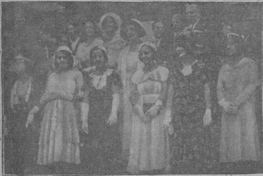
Grupo de bellas señoritas que actuaron de madrinas de las banderas republicanas