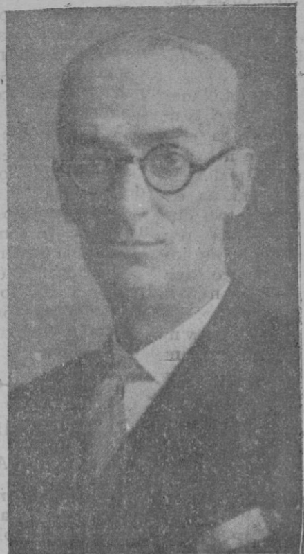
Baltasar Samper, prestigioso compositor, que será hoy obsequiado con un banquete, con motivo de sus recientes éxitos