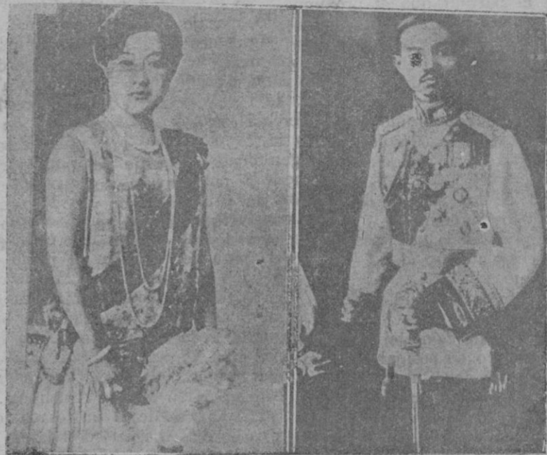
Los soberanos de Siam, que llegaron ayer a Nueva York

y el orden público, y en la estructuración de la nueva República. Para obtenerla, los Ayuntamientos, elegidos por sufragio universal se reunirían en cada región, a fin de determinar la constitución de éstas, y las regiones reunidas en Asamblea Federal determinarían las atribuciones del Estado Federal. Hacerlo de otro modo equivaldría a seguir como hasta ahora.