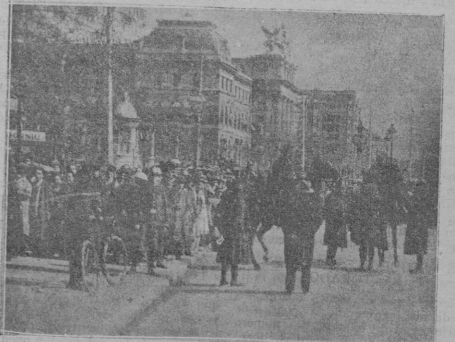
El público, contenido por la fuerza pública, presenciando el desarrollo de los desórdenes

ron también proyectiles por lo que hubo que cerrarla, pretendiendo los estudiantes penetrar en la posada para asesinar a los policías que había dentro según se les oía decir.