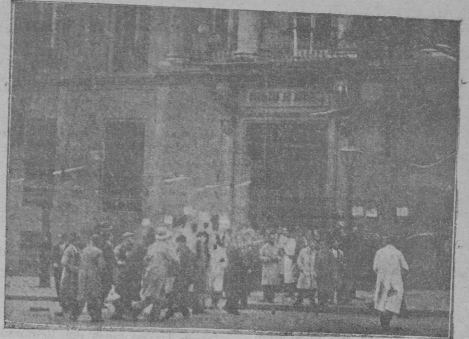
Los estudiantes a la puerta de la Facultad de Medicina al originarse los sucesos