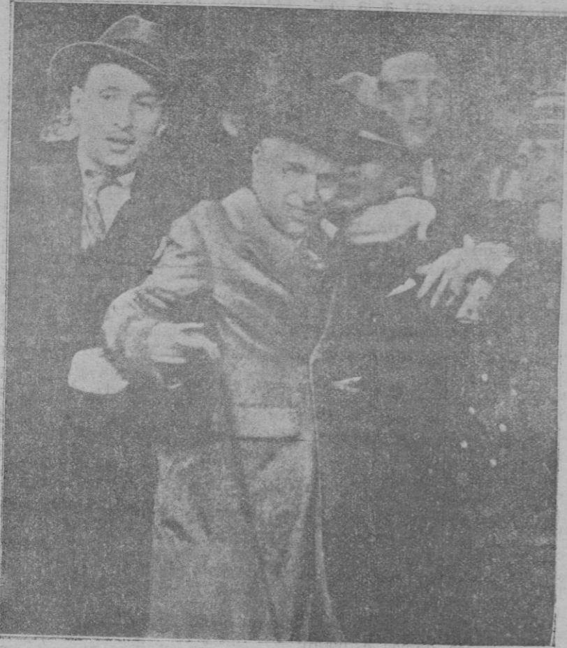
Charles Chaplin al llegar a París, rodeado de la multitud que le ovacionaba. La fuerza pública tenía que protegerle