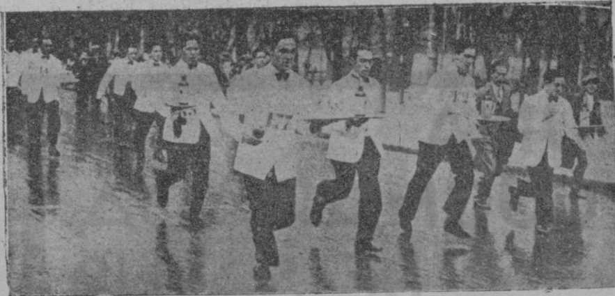
Concurso de camareros celebrado en Madrid, llevando el servicio

literaria, habrá habido como el del po-lígrafo latino Aulo Gelio, lector imper-térrito, perseguidor tenaz de curiosida-des, ameno narrador de anécdotas, doc-tas y autor, a la vez, en quien el amor de hacer los libros subió hasta la pa-sión, se encendió hasta el entusiasmo y se escandeció hasta la orgía. El ro-manzamiento y publicación de sus «Noches áticas» en la serie de la «Fun-dación Bernat Metge», le dan una actualidad coincidente con la Fiesta del Libro español señalada para el día aniversario de la muerte de Miguel de Cervantes. ¿Estimular el amor del libro? El amor del libro antes que en el lector residió en el autor. Antes que el lector arase con el doble surco de sus ojos, las páginas vírgenes; el autor las había llevado en sus entrañas y las había gestado en su mente crea-dora.