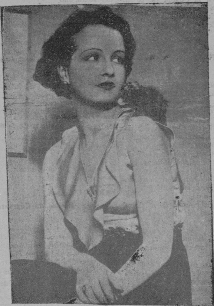
Bella muchacha londinense que Charlot pensa llevar-se a Hollywood para impresioner con ella, películes