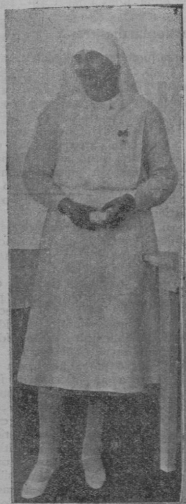
S. A. R. la infanta doña María Cristina ha sido operada felizmente de apendicitis en el Sanatorio de San José y Santa Adela

Recientemente han entrado en el campo revolucionario algunos espíritus selectos, hombres sin historia o con historia irreprochable, con un candor angelical que les permite creer que en 1931 sería posible una revolución política que no fuera, inmediatamente, devorada por una revolución social, que derivaría hasta el bolchevismo inorgánico, es decir, hasta el saqueo y el asesinato libres, como fueron las «jacqueries medievales de cuyo estallido tuvimos algunos ejemplos en Cataluña. Acaso, en algún lugar lugar, podríamos ver realizado el programa sencillísimo y humanísimo del anarquista de Tarrasa, que decía así: «Al llegar el día del triunfo, mataremos a los burgueses y a nuestras mujeres, y nos repartiremos los bienes y las mujeres de los burgueses,