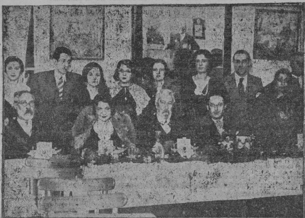
Sitges: Banquete ofrecido por el Ayuntamiento en honor al insigne autor y a la celebrada compañía argentina con motivo de la representación de la obra de Rusiñol «El Indiano»