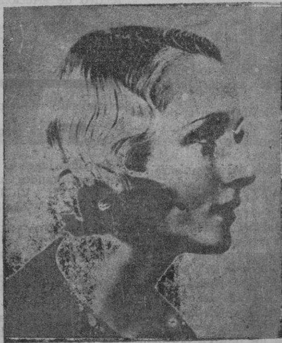
Nuevo modelo para cabellos largos

le obligaron a confesar pretendidos crímenes; pero como continuaba manifestando su inocencia, le cortaron la lengua; después le hicieron sufrir el suplicio de «los diez mil pedazos», cortándole en trozos e ingeniándose a hacerle vivir el mayor tiempo posible. Los comunistas quemaron después el cuerpo; pero guardaron su cabeza, que clavaron en un pedazo de madera, y la arrojaron al río, de manera que la corriente la llevase a la región ocupada por las tropas regulares. Allí fué descubierta por los soldados de dicha división 77. En la madera había grabada la frase siguiente: «Esta es la cabeza del general Tchang-House-Chan; os enviamos esta cabeza como advertencia, pues los comunistas harán lo mismo con los jefes del Gobierno y con los otros generales que los ataquen».