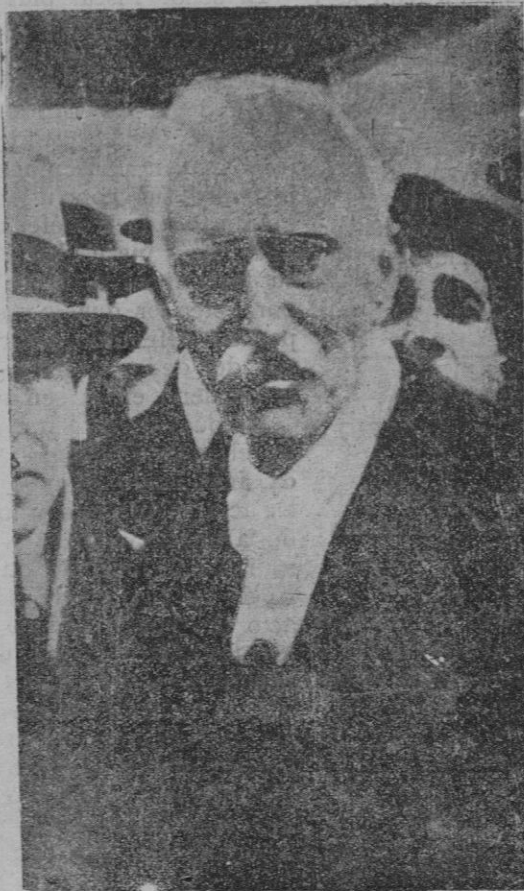
El batallador político catalán al llegar a Barcelona después de una ausencia de siete años

existencia de una gran masa republicana en España?