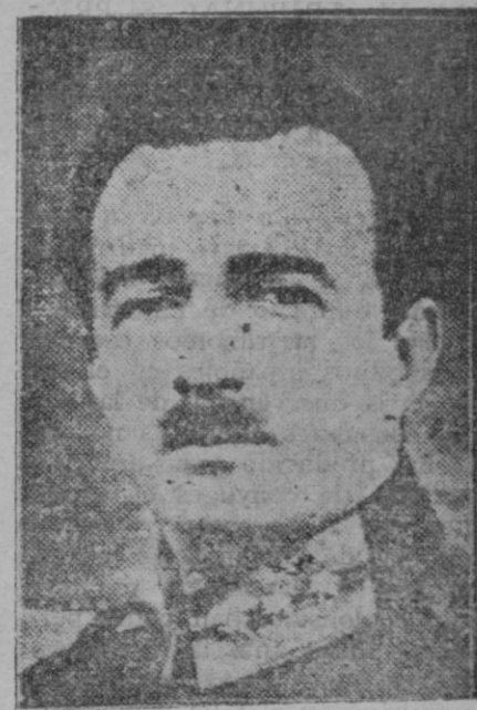
El Rey Zog, que ha sido objeto de un atentado en Viena, del que ha resultado ileso

que se llama Sábado de Gloria por antonomasia? En aquel día el ministro con la solemidad máxima, desde lo alto del púlpito, entona un himno en loor de la luz nueva que palpita y tiembla como un ave joven en lo alto del cirio pascual que la alimentará. Celebra con la más exaltada de las poesías todos los elementos que lo integran y ¿cómo callar la cera que nutre el sagrado fuego y callar la abeja, madre de la cera, nutriz de la llama? En la liturgia actual sólo un oblicuo elogio se hace de la madre abeja que elaboró la cera licuéscente, pábulo de la antorcha preciosa. Pero en los siglos remotos, más próximos a Cristo y a Virgilio, se cantaba un ditirambo magnífico en que las amplias curvas de la poesía virgiliana perdíanse en las grandiosas espirales del ansia cristiana. El elogio que cantaba el arcediano en lo elevado del ambón con la más solemne y más amplia y alada de las poesías en loor de la breve abeja oficiosa, decía así: