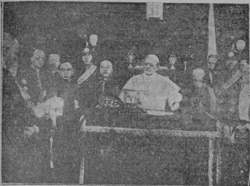
S. S. el Papa ante el micrófono al ir a pronunciar el discurso solemne con que se inauguró la estación del Vaticano