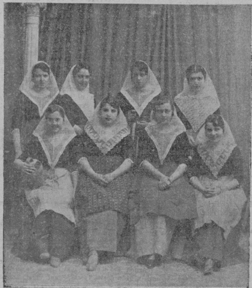
Lindas señoritas y muchachitas que lucían artísticos disfraces

Cabe esperar del distinguido abogado, que, entrando de lleno en los campos del arte teatral y echando mano del personaje femenino, nos dé