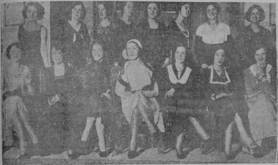
Sentadas de izquierda a derecha, Italia, Estonia, Bélgica, Francia, Hungría, Inglaterra y Dinamarca; en pie, de izquierda a derecha también, Yugoslavia, Austria, Rumania, Alemania, Turquía, Grecia, Holanda, y España