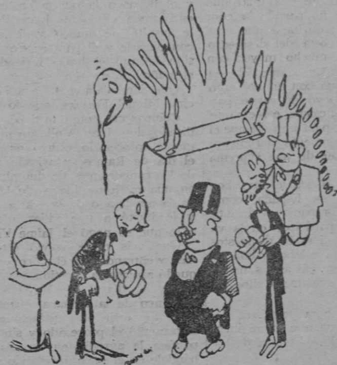
El Director del Museo.—Vea el señor ministro este espléndido cráneo de orangután. —Ya lo veo; puede usted cubrirse.