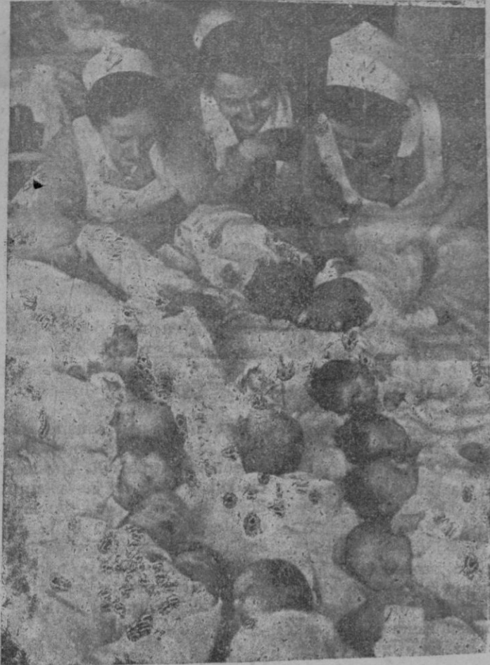
Los recién nacidos recogidos en la noche de Año Nuevo.