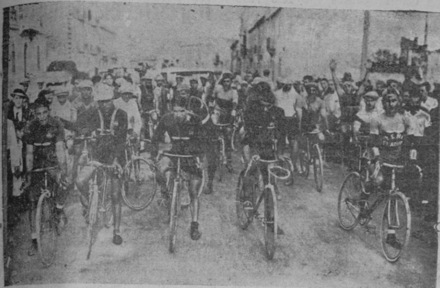
Los corredores, en el momento de emprender la marcha.