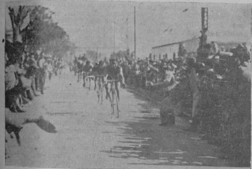
La llegada a la meta.