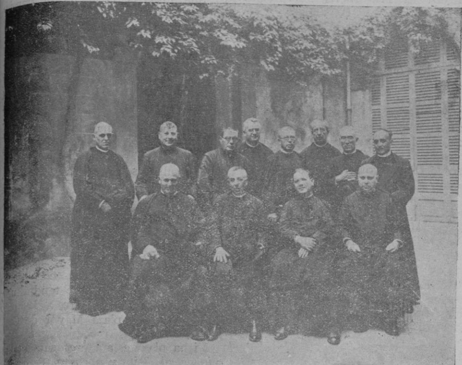
Los reverendos sacerdotes que celebraron diversos actos con motivo de cumplirse los 25 años de su ordenación sacerdotal