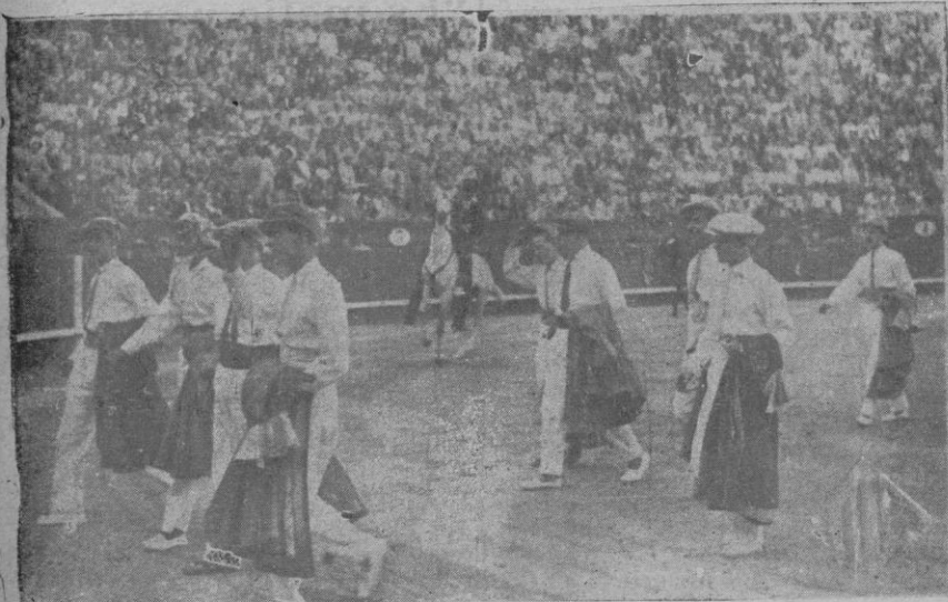
Desfile de los aficionados que tomaron parte en la lidia