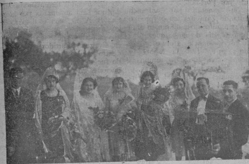
Grupo de las bellas señoritas que presidieron el festival taurino