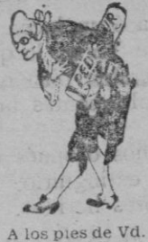
A los pies de Vd.

De venta en todas las Farmacias, Droguerías, y en los Laboratorios Botánicos y Marinos, Ronda Universidad, 6, Barcelona; y Peligros, 9, entresuelo, Madrid. Venta en Palma, Farmacias: Vda de Forteza, Bolsería, 1; G. Vanrell, Jaime II, 107; Vda. de Rey, Colón, 37 Calafell, Sindicato; Trián, San Miguel, 157; Miró, Colón, 18; Castañer, San Jaime y Farmacias; en Ibiza Farmacia Puget y Farmacias; en Mahón, Ruiz Cuevas, Arrabaleta, 5 y Farmacias; en Felanitx, Farmacia Matas y Farmacias.