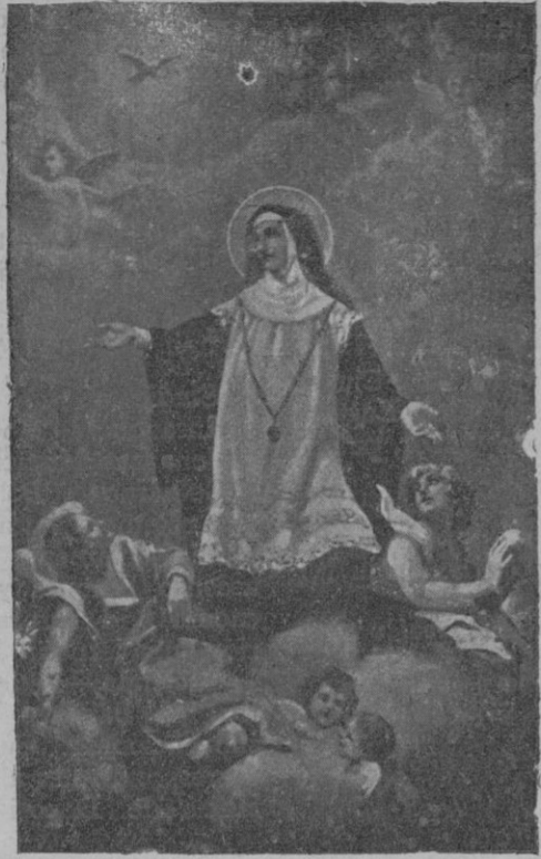
Reproducción de las primeras estampas de la nueva Santa, editadas en Roma, y que se entregaban el día de la Canonización